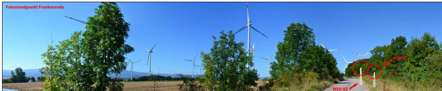
Abbildung 8-4: Blick von Frankenroda auf die Windenergieanlagen