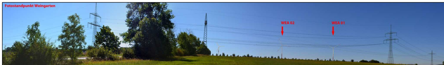
Abbildung 8-5: Blick von Weingarten auf die Windenergieanlagen