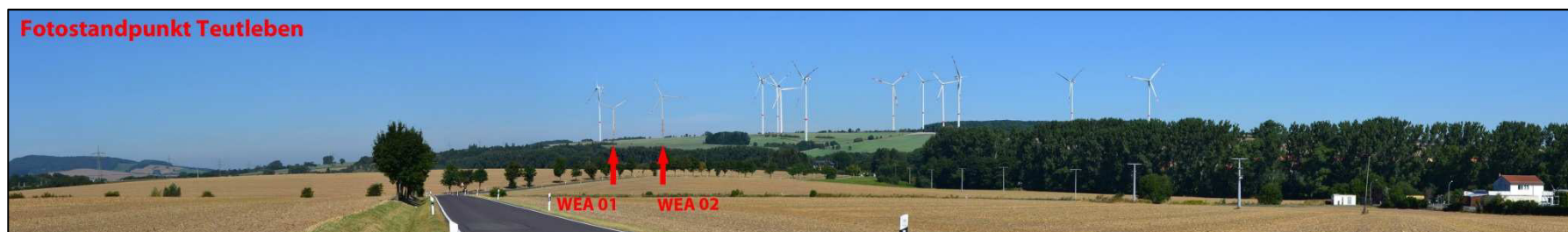
Abbildung 8-3: Blick von Teutleben auf die Windenergieanlagen