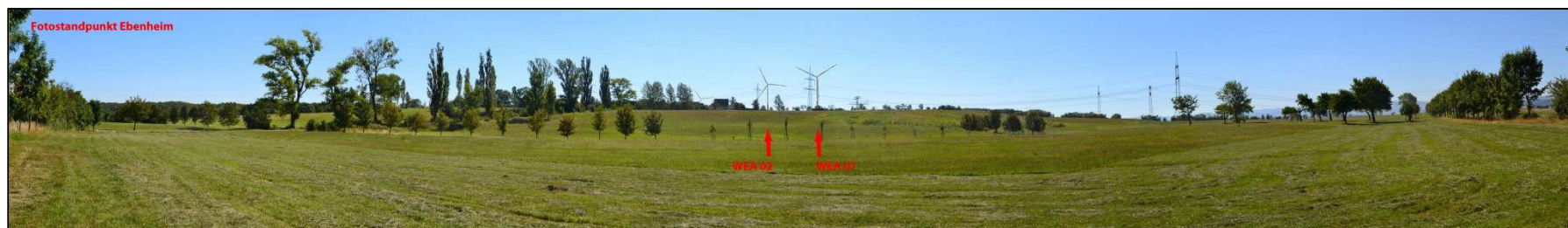
Abbildung 8-6: Blick von Weingarten auf die Windenergieanlagen