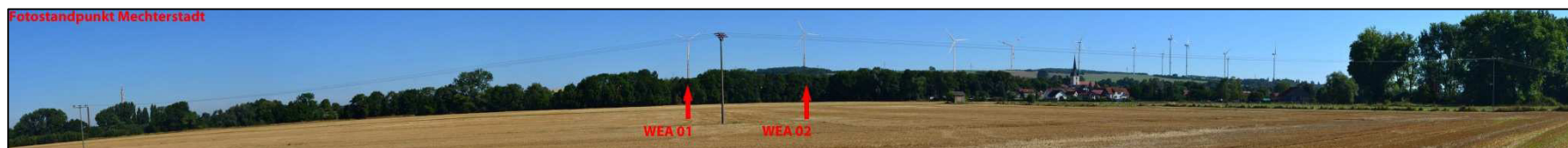
Abbildung 8-2: Blick von Mechterstätt auf die Windenergieanlagen