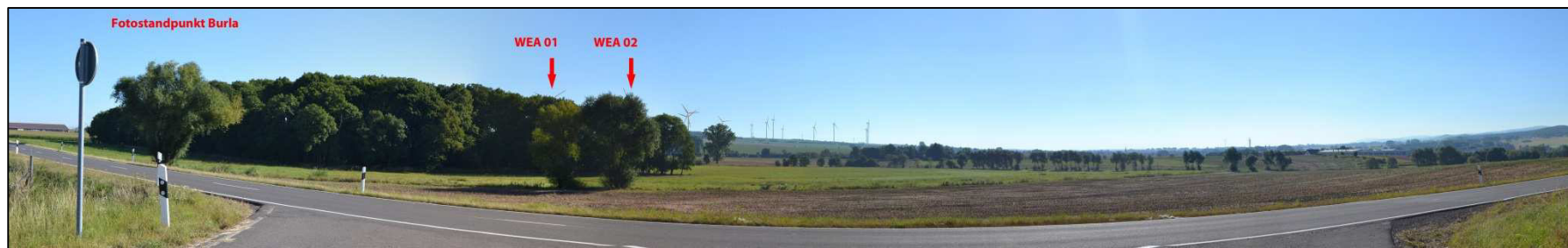
Abbildung 8-1: Blick von Burla auf die Windenergieanlagen