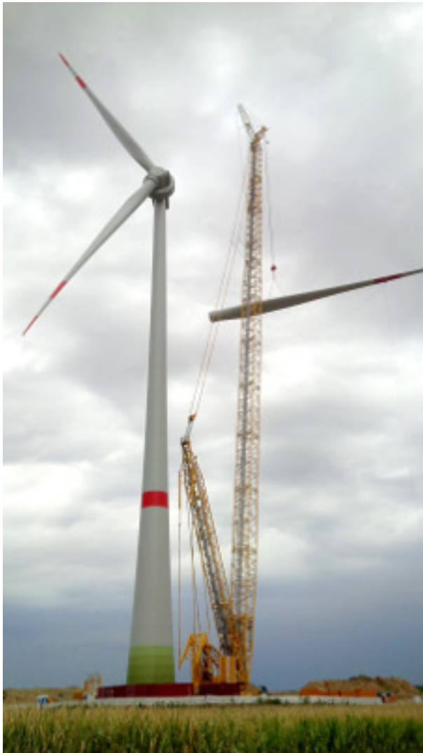
Abb. 3: Rotorblatt am Kran angeschlagen

Eventuell schließen sich weitere Demontagearbeiten wie das Trennen mehrteiliger Rotorblätter, der Abbau des Hinterkantensegments oder der Ausbau der Blattheizung an. Wenn das Rotorblatt auf eine transportfähige Größe zurückgebaut wurde, wird es verladen und abtransportiert.