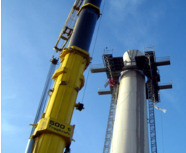
Abb. 8: Arbeitsplattform außen

Eine Betonwand- oder Seilsäge wird in den Bereich der horizontalen Schnittfuge gesetzt. Die Schnitte erfolgen in den vorhandenen Fugen. Während des Trennens werden die Schnittfugen mit Stahl- oder Holzkeilen gesichert.