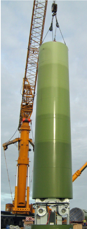
Abb. 6: E-Modul unter einer angeschlagenen Stahlsektion

Das E-Modul befindet sich in der Regel im Turmfuß. Es besteht aus verschiedenen Ebenen, die zum Teil verschraubt oder gesteckt sind. Bevor das E-Modul demontiert werden kann, müssen alle Kabel bis auf E-Modul-Ebene zurückgeführt werden.