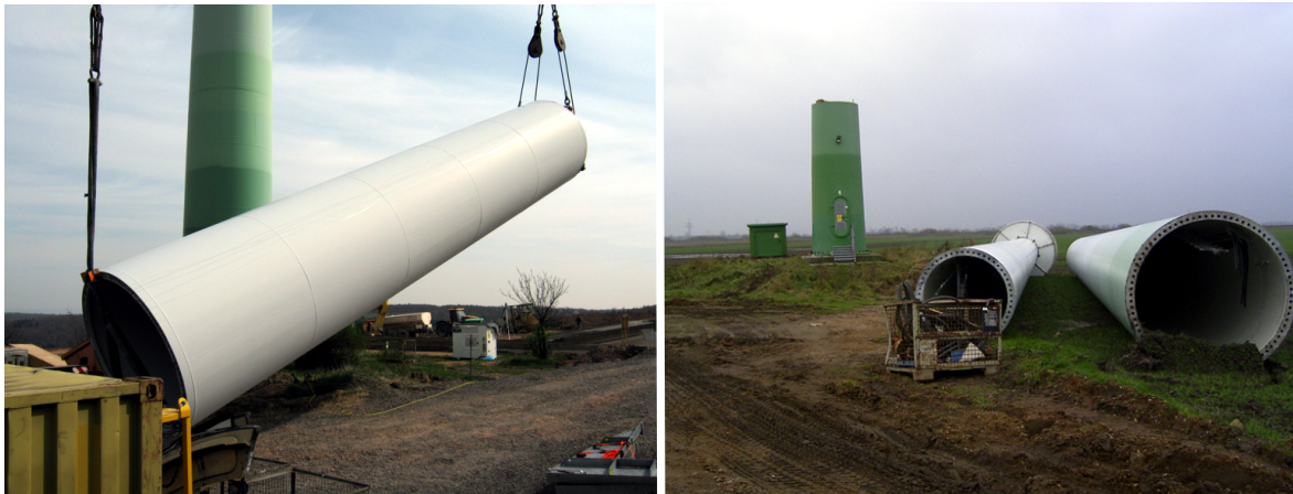
Abb. 16: Stahlsektion beim Ablegen (links), demontierte Stahlsektionen (rechts)

Bei der Demontage eines Stahlturms werden Werkzeuge und Hebemittel zum Anschlagen der Stahlsektion auf Demontagehöhe gebracht. Ein entsprechendes Hebemittel wird mit dem Flansch der Stahlsektion verbunden und an den Kran angeschlagen. An den Stellen, an denen die angeschlagene Stahlsektion demontiert wird, werden die Steigleitersegmente und eventuell noch vorhandene Kabel und Einbauten getrennt. Wenn der Demontekran das Gewicht der Stahlsektion aufgenommen hat, werden alle bis auf 2 Schraubverbindungen an der Stahlsektion gelöst. Der Kran hebt die Stahlsektion an, bis ein Spalt entsteht. Anschließend werden die letzten Schraubverbindungen gelöst. Die Stahlsektion wird abgesenkt und mit Hilfe eines zusätzlichen Hilfskrans von der Senkrechten in die Waagerechte gebracht und abgelegt.