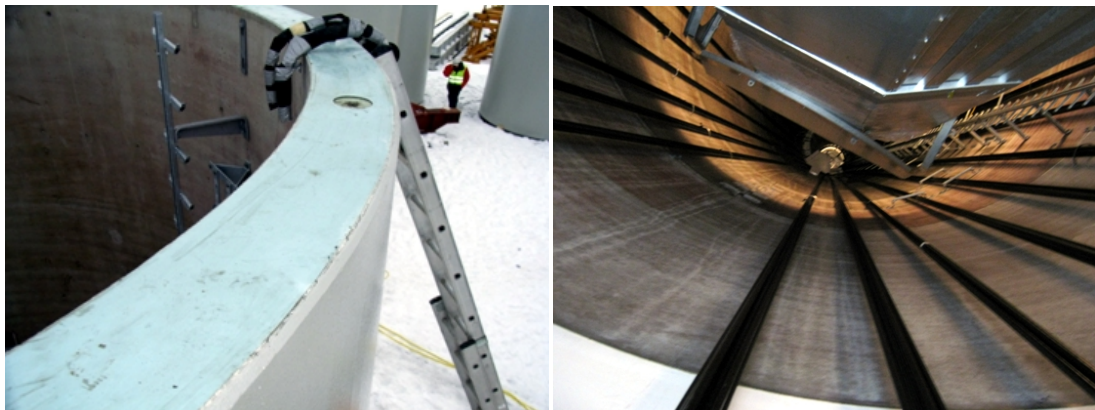
Abb. 7: Horizontale Fuge geebnet (links), Spannglieder an der Turminnenseite (rechts)

Die Spannglieder verlaufen entweder innerhalb der Betonsegmente in vergossenen Hüllrohren oder an der Innenseite des Turms.