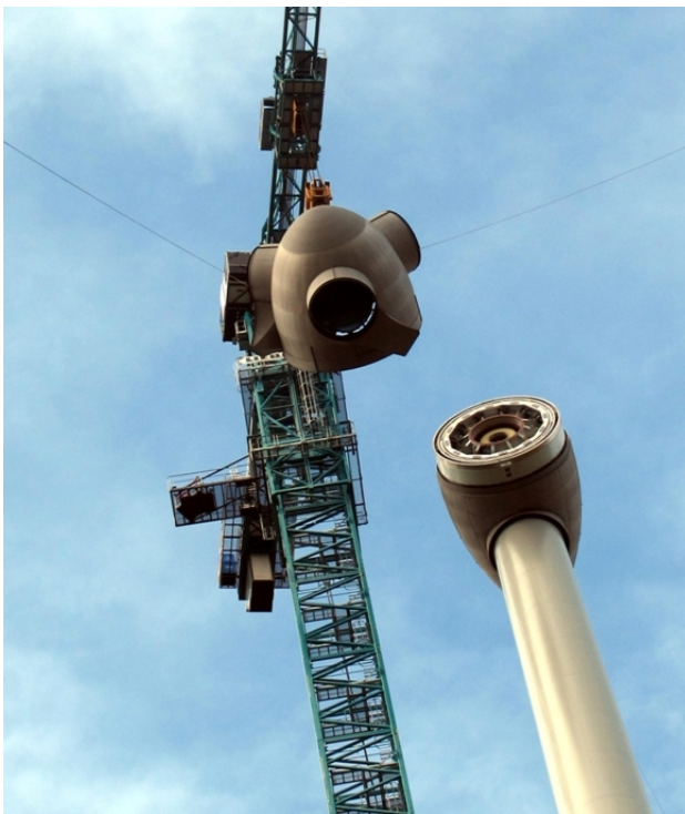
Abb. 4: Rotorkopf angeschlagen

Bei Windenergieanlagen der Plattform EP1 wird der Rotorkopf zusammen mit dem Generator gelöst und abgesenkt. Bei anderen Windenergieanlagentypen wird der Rotorkopf vom Generator gelöst und abgesenkt. Am Boden wird der Rotorkopf standsicher gelagert und weiter demontiert. Anschließend werden alle Teile verpackt und abtransportiert.