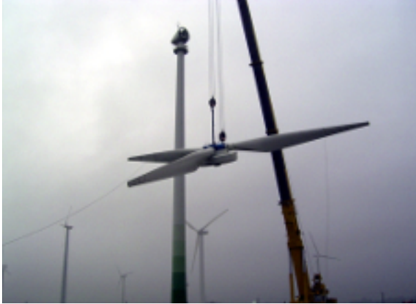
Abb. 2: Absenken des Rotorkopfs mit Rotorblättern

Am Boden wird der Rotorkopf standsicher gelagert, die einzelnen Rotorblätter werden ge- sichert und demontiert.