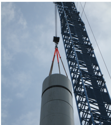
Abb. 11: Angeschlagenes Betonsegment

Die Betonsegmente werden an den vorhandenen Anschlagpunkten zum Heben angeschlagen und nacheinander heruntergehoben. Vertikale Verbindungen werden am Boden getrennt.