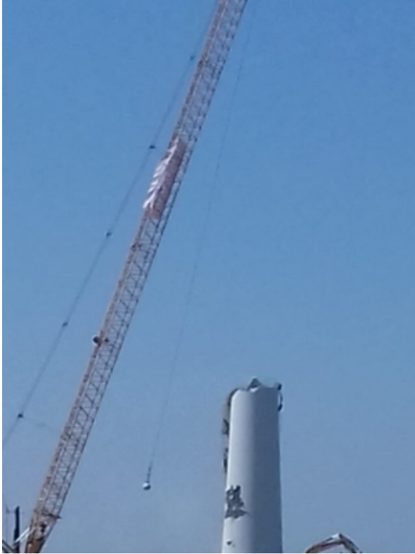
Abb. 14: Abbruch durch Prallgewicht

Da der Kran mit dem Prallgewicht in seiner Arbeitshöhe begrenzt ist, wird er in Verbindung mit anderen Technologien eingesetzt. Das Verfahren ist effektiv und kostengünstig und kann bis zu einer Turmhöhe von 90 m eingesetzt werden.