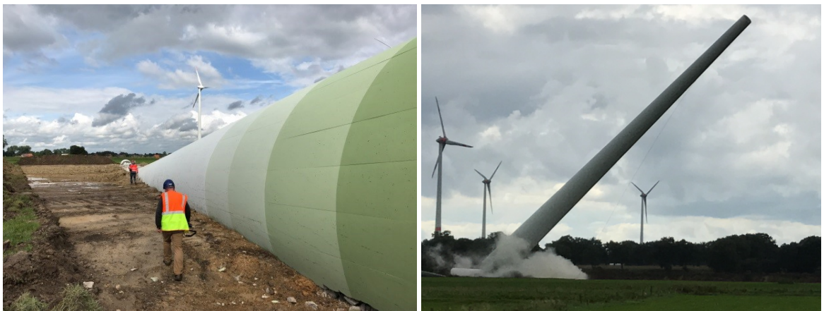
Abb. 13: Umgelegter Turm (links), kontrolliertes Fallen des Turms (rechts)

Der Einsatz eines Krans oder einer Arbeitsplattform und die Demontage der einzelnen Betonsegmente sind nicht erforderlich.