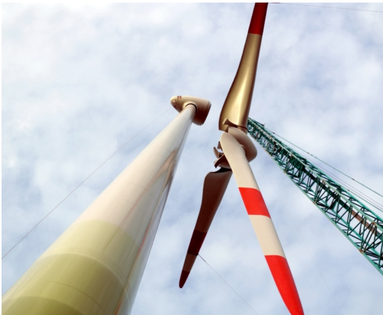
Abb. 1: Demontage einer Windenergieanlage

Für Standorte, an denen mit hohen Wasserständen zu rechnen ist, muss eine ausreichend dimensionierte geschlossene oder offene Wasserhaltung geplant werden.