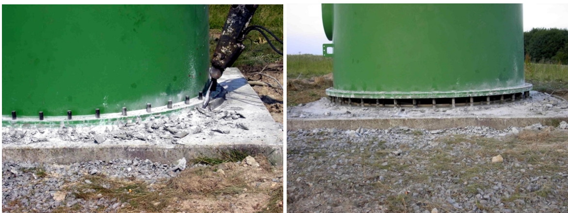
Abb. 17: Trennen und Anheben der untersten Stahlsektion beim Turm mit Bolzenkorb

An der Stahlsektion werden anschließend Transportgestelle angebracht. Die Sektion wird verladen und abtransportiert. Die im Turmflansch verbliebenen Schrauben werden gesichert. Der Demontagevorgang wird an der nächsten Stahlsektion wiederholt.