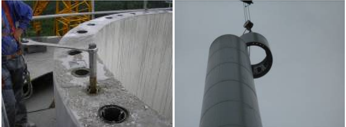
Abb. 10: Nachschneiden beschädigter Gewinde (links), Herunterheben einzelner Segmente (rechts)

Das Material kann anschließend verladen und abtransportiert oder vor Ort durch einen Abbruchbagger zerkleinert werden.