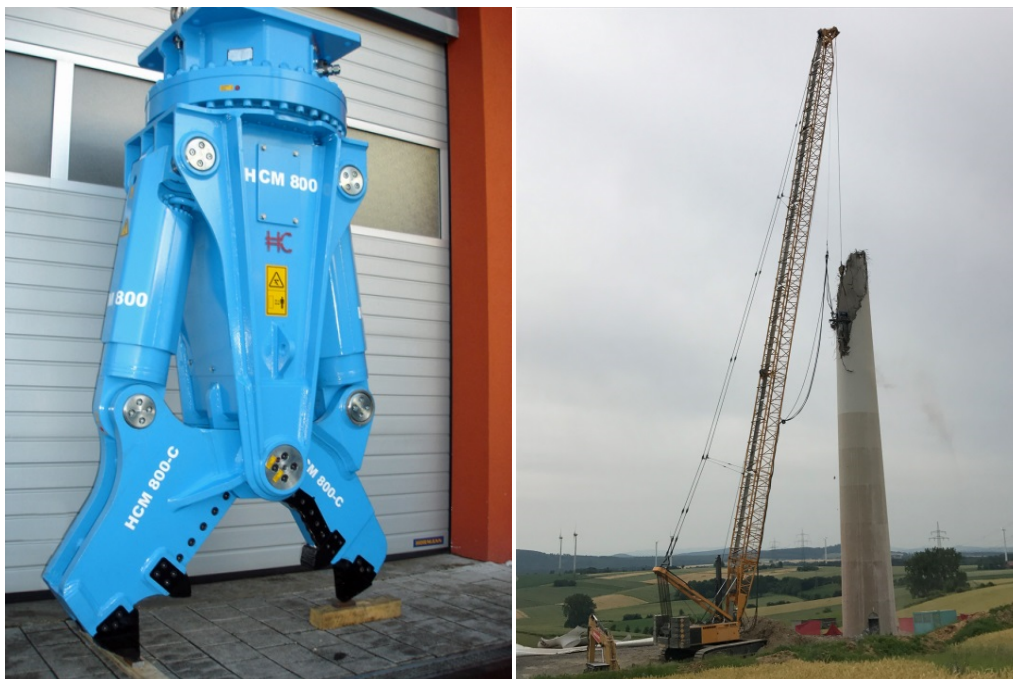
Abb. 12: Abbruchbagger mit Teleskoparm und Abbruchschere (links), Seilbagger (rechts)

Da Abbruchbagger in ihrer Arbeitshöhe begrenzt sind, werden sie in Verbindung mit anderen Technologien eingesetzt.