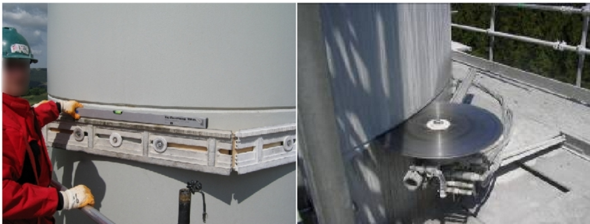
Abb. 9: Führungsschiene für die Betonwandsäge am Segment verschraubt (links), Betonwandsäge (rechts)

Eine Betonwand- oder Seilsäge wird in den Bereich der horizontalen Schnittfuge gesetzt. Die Schnitte erfolgen in den vorhandenen Fugen. Während des Trennens werden die Schnittfugen mit Stahl- oder Holzkeilen gesichert.