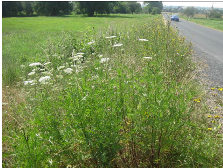
Abbildung 20: Straßenbegleitvegetation nahe der Weißen Elster