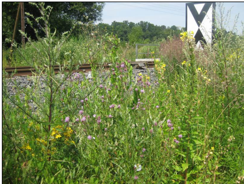
Abbildung 21: Bahndammvegetation