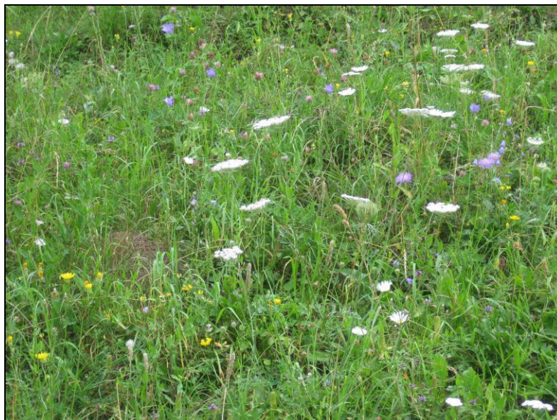
Abbildung 24: Bunte Wiese im Seifartsdorfer Grund zwischen Senke und Waldrand