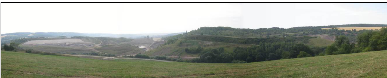
Abbildung 4: Blick auf die Bergbaufolgelandschaft im Zentralfeld