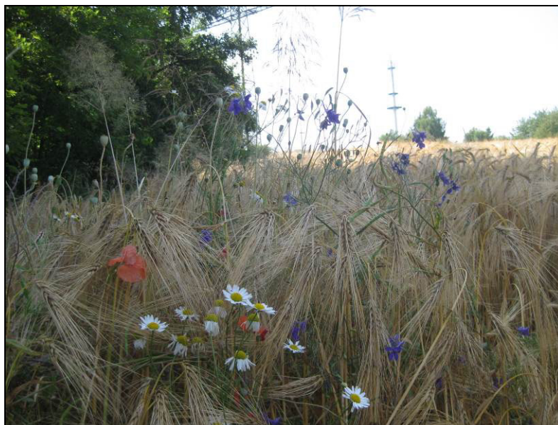
Abbildung 22: Ackerrandvegetation, im Hintergrund: Sendemast südlich Hartmannsdorf