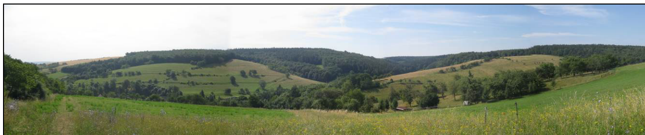
Abbildung 19: Seifartsdorfer Grund