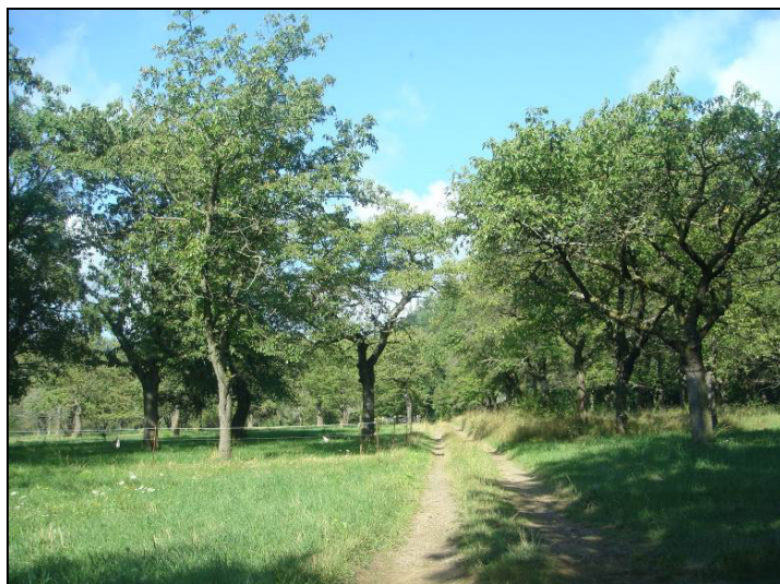
Abbildung 16: Streuobstwiese westlich von Gleina