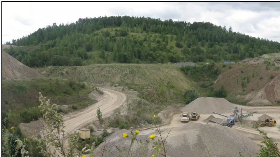
Abbildung 6: die sich bereits begrünenden Bermen des Läuseberges (Südkippe), rechts im Bild: mobile Aufbereitungsanlage