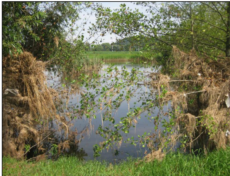
Abbildung 12: Reste der Flut vom Juni 2013 am Dreiecksteich