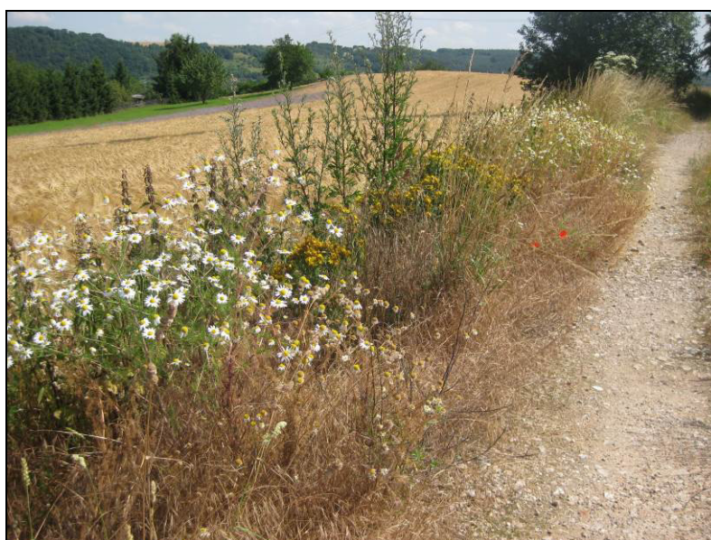
Abbildung 23: Wegrand nahe des Sendemastes südlich von Hartmannsdorf