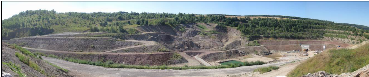
Abbildung 1: Blick von der Westkippe in den Grabeneinschnitt