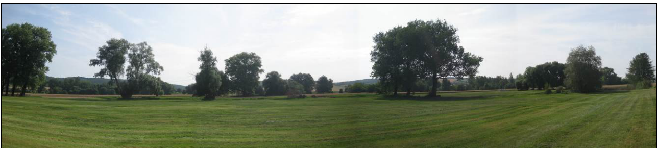
Abbildung 11: Grünland am Meistereich