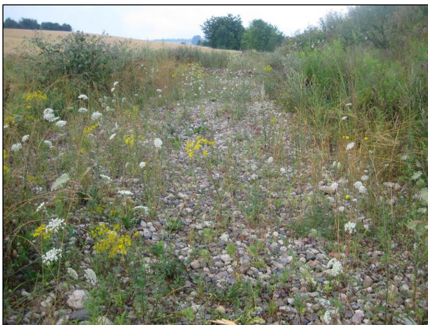
Abbildung 7: Schotterflur am Südrand des Tagebaus, westlich des „Gebindes“ Caaschwitz