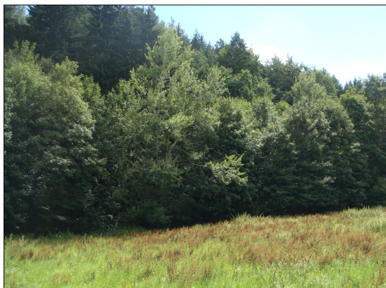
Abbildung 25: Gehölzbestand am geplanten Durchschlag ins Trockental - Sommeraspekt