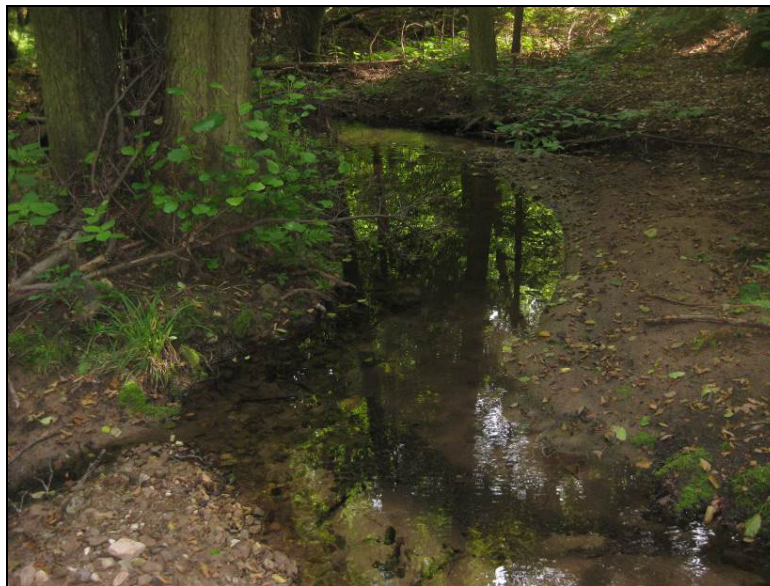
Abbildung 13: Die Sinke im FND Kaiserquelle