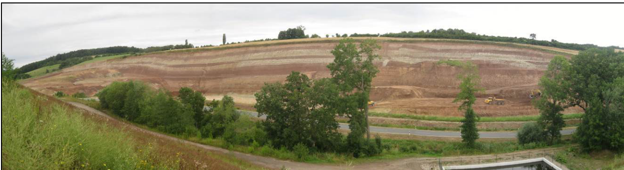
Abbildung 3: Blick auf das Nordfeld II