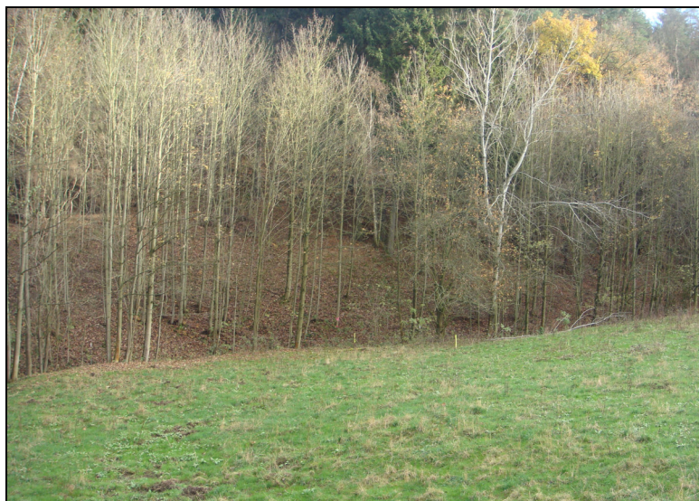
Abbildung 26: Gehölzbestand am geplanten Durchschlag ins Trockental – Spätherbstaspekt