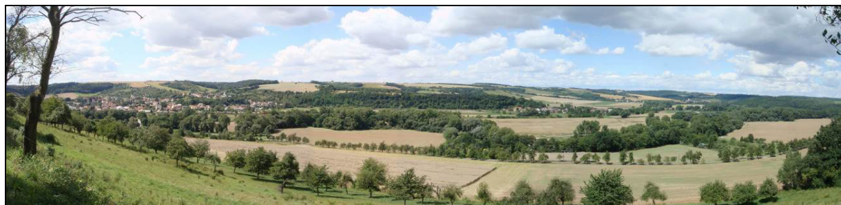
Abbildung 15: Die Elsteraue bei Crossen und Ahlendorf.