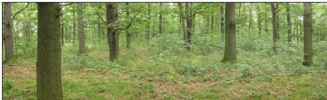
Abbildung 27: Traubeneichenwald im Norden des Lerchenberges