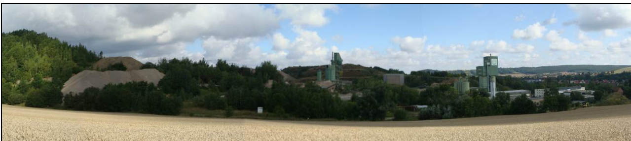
Abbildung 2: Blick auf das Betriebsgelände des Dolomittagebaus Caaschwitz von der Ackerflur nördlich von Gleina.