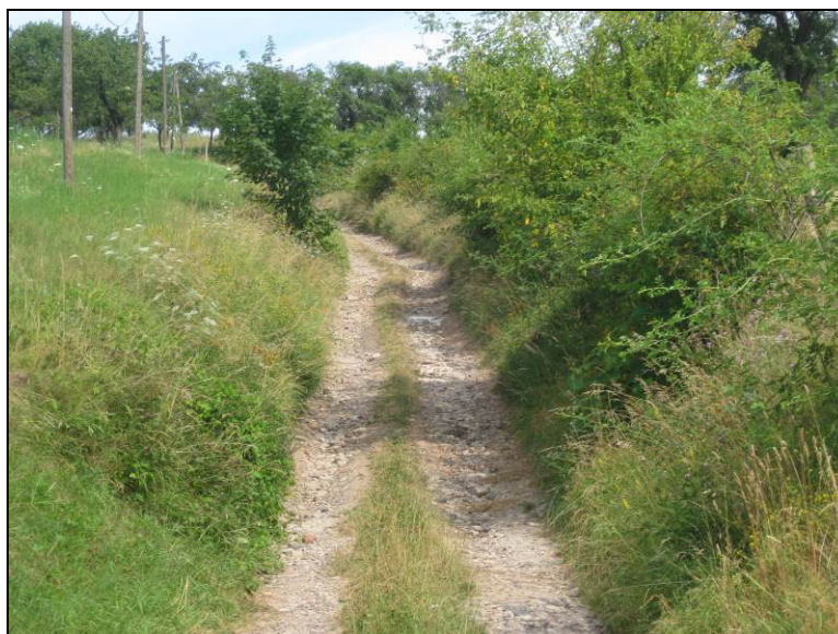
Abbildung 18: Hohlweg bei Seifartsdorf