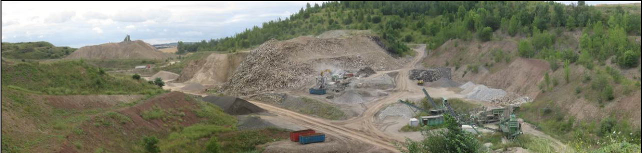
Abbildung 5: Spontanvegetation auf dem Betriebsgelände. links im Bild: lückige Vegetation auf Betriebsböschungen. zentral im Bild: Brecheranlage, rechts im Bild: Pioniergehölze