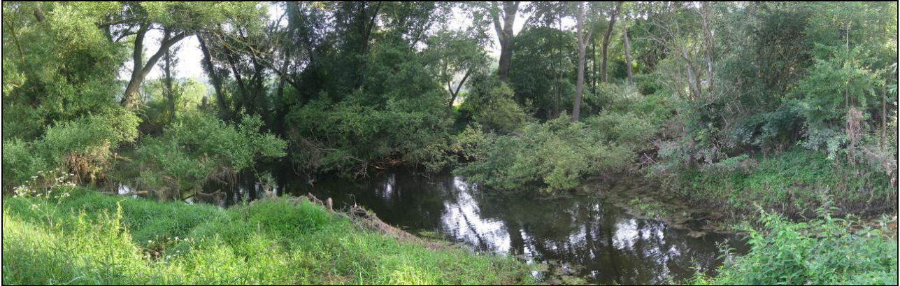
Abbildung 9: Ausschnitt aus dem westlichen Altwasser im FFH-Gebiet „Elsteraue bei Bad Köstritz“