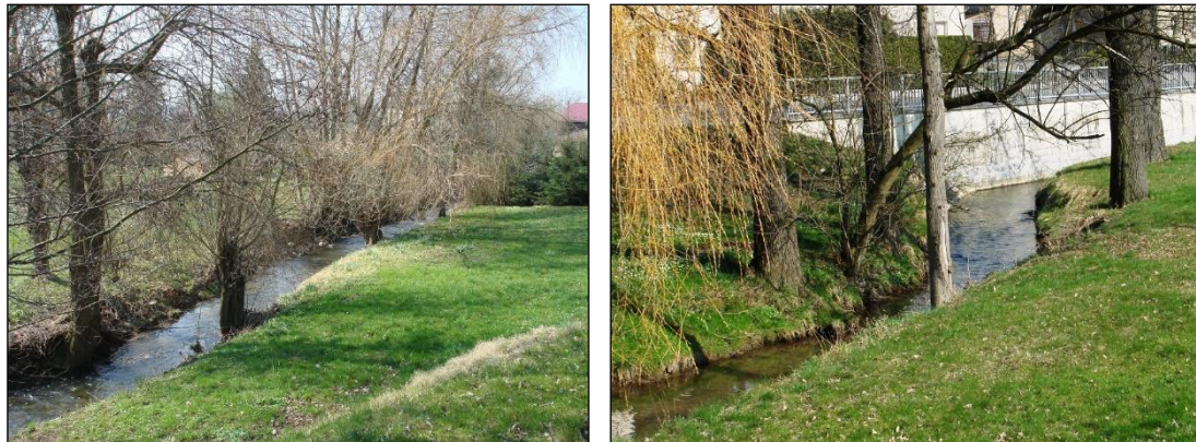
Abb. 4: Haselbach in Gersdorf

Der Haselbach ist entsprechend den Vorgaben der Wasserrahmenrichtlinie (WRRL) wie folgt charakterisiert (LFULG 2019G):