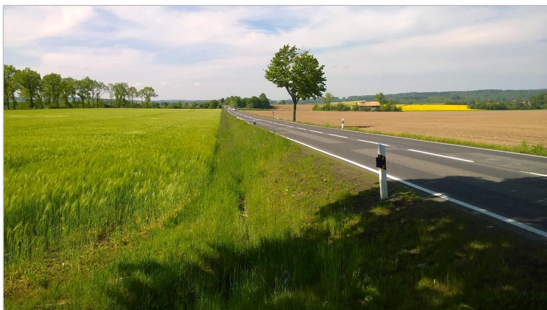
Abb. 2: Überblick über die Landschaft zwischen Gersdorf und Abzweig nach Hennersdorf