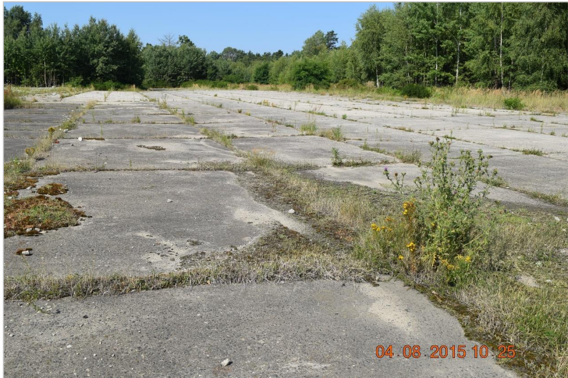
Abb. 5: Maßnahmenfläche 1 A, ehemaliges NVA-Gelände Straßgräbchen

ehemaligen Militäranlagen war mit Betonplatten und Punktfundamenten für Gebäude versiegelt. Diese wurden mit Zustimmung der Bundesanstalt für Immobilienaufgaben entsiegelt, entsorgt und durch den Bundesforst mit Laubmischwald aufgeforstet bzw. ein Teilstück als Ruderalflur erhalten. Aufgrund der Größe der Fläche und der Werterhöhung wird sie ebenfalls zur Kompensation der Eingriffe aus dem vorliegenden 3. Bauabschnitt des Ausbaus der S 95 verwendet (Maßnahme 1 A). Hierzu erfolgte die Zustimmung der zuständigen Naturschutzbehörde (LRA BAUTZEN 02.07.2019).