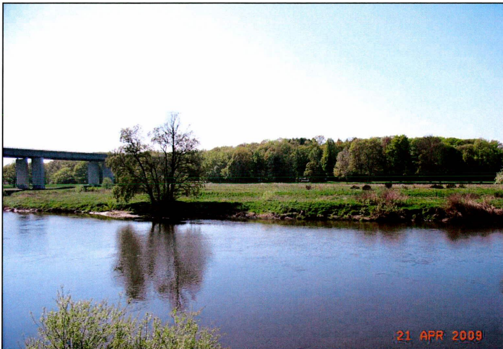
Abb. 3 Blickachse zu den UF 14, 12 und 7