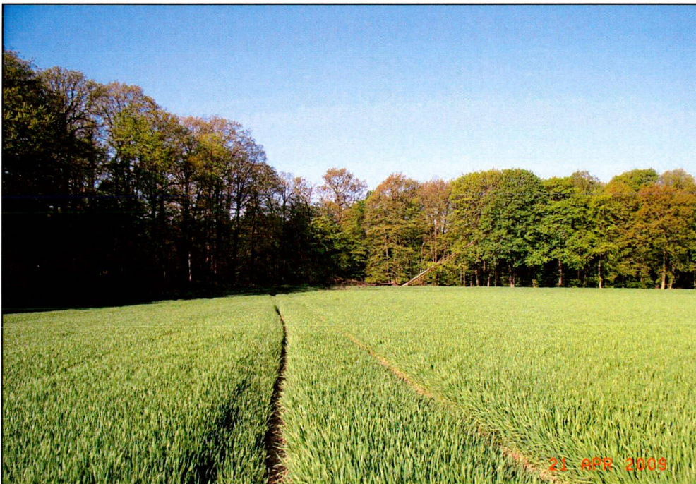
Abb. 4 Blickachse von der UF 17 Richtung West auf die UF 16