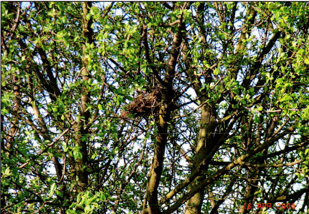
Abb. 6 Amselnest In UF 22