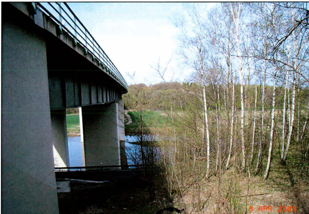
Abb. 1 Autobahnbrücke A 14 (= UF 36), -Blickachse nach West auf die UF 26 (rechts im Vordergrund) und die UF 14 27, 28 und 7)