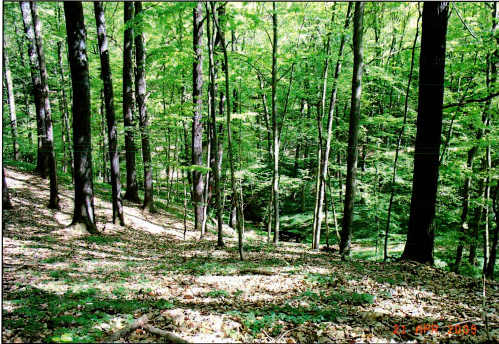
Abb. 7 Bild der Habitatstruktur der UF 16 (Anfang April 2009)