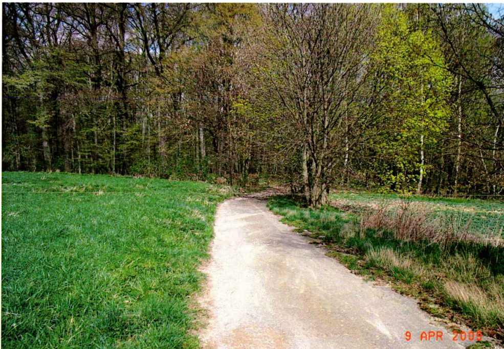
Abb. 8 Blickachse entlang des Weges, welcher die UF 20 und 21 trennt. Im Bildhintergrund die UF 22