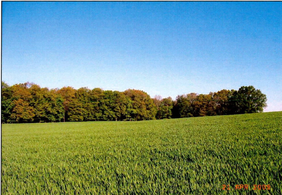
Abb. 5 Blickachse von UF 17 in Richtung Nordwest zu UF 16