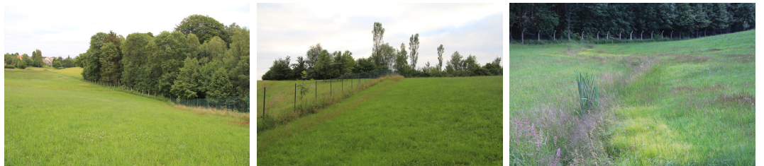
Aufforstungsfläche Flurstück 1473/3 Pulsnitz (, 24.06.2015)