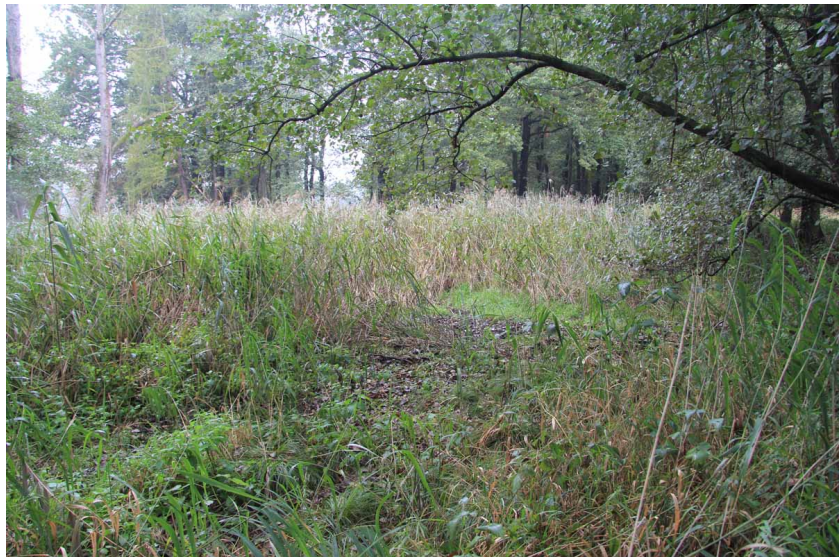
Ehemaliger Teich fast vollständig verlandet (19.10.2015,)