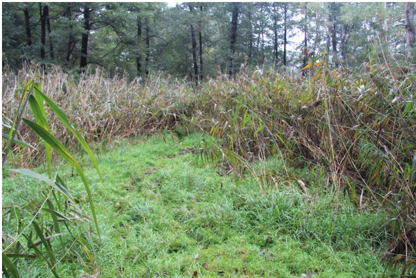
umlaufend Schilf, mittig Rasen, kein stehendes Wasser (19.10.2015,)