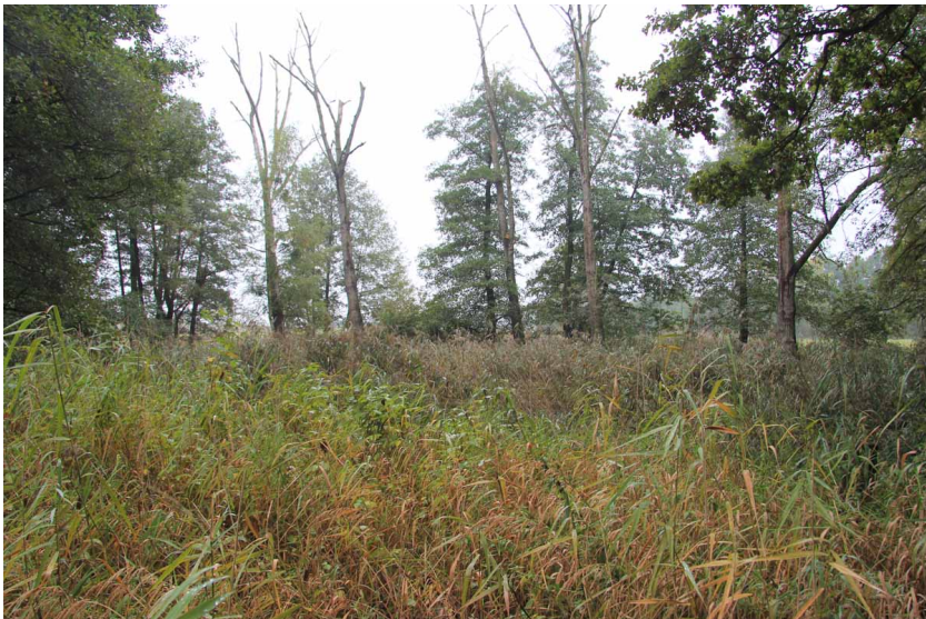
randseitig teilweise abgestorbene Bäume (19.10.2015,)