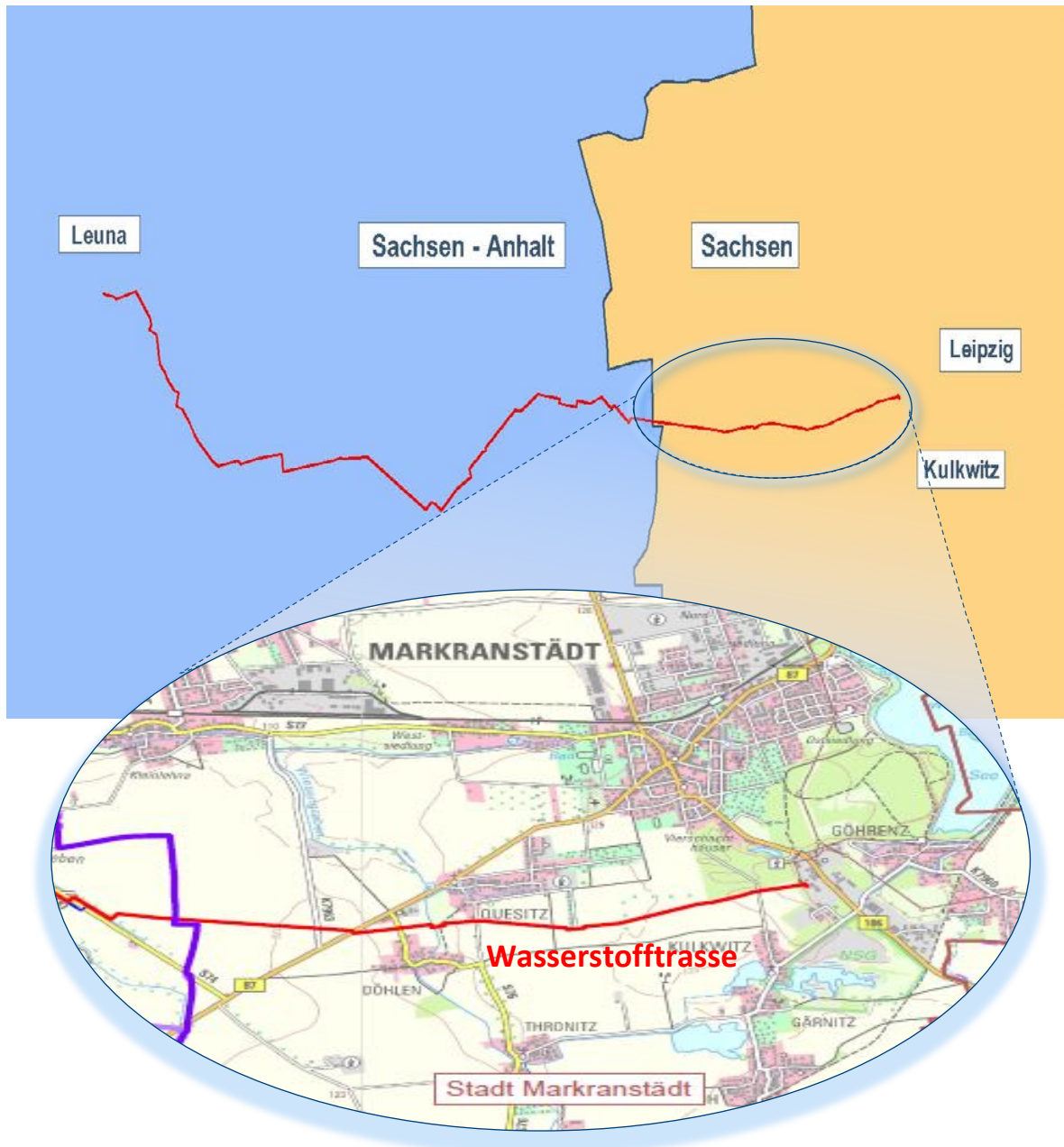
Unterlage 02.01 Übersichtsplan politische Grenzen