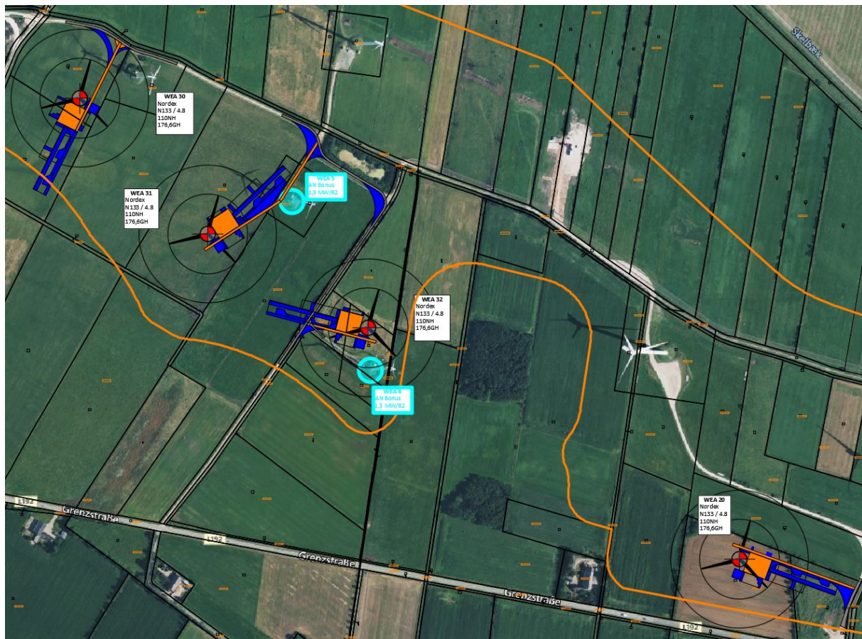
Abb. 2 – Windpark Ellhöft Ost