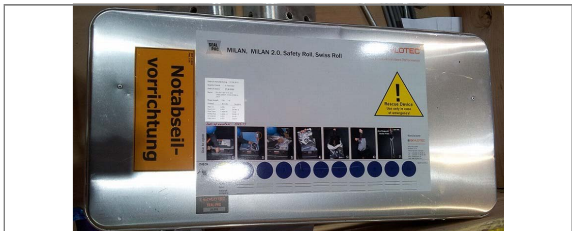
Abb. 3: Notabseilausrüstung in der WEA