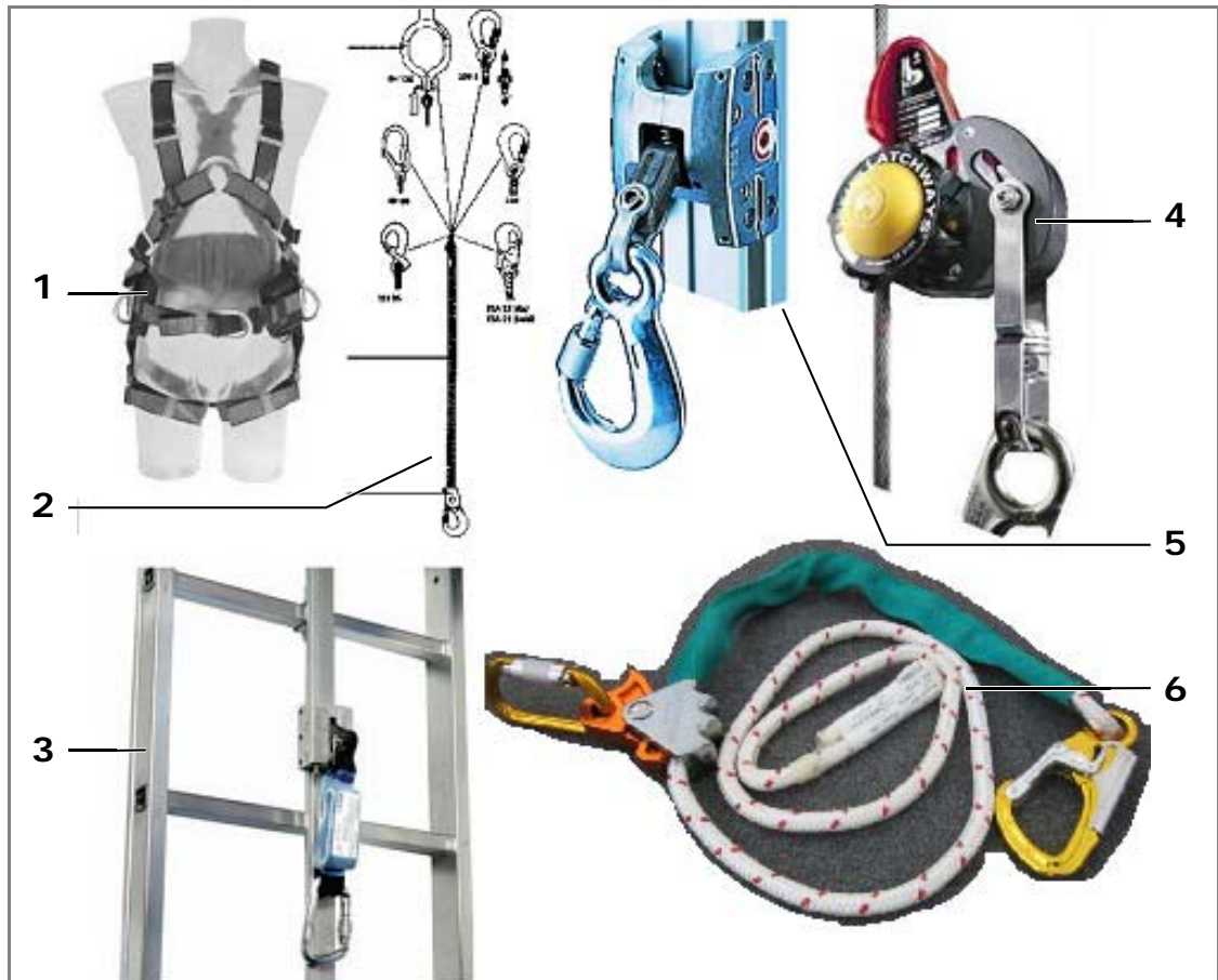
Abb. 2: Beispiele für Teile der persönlichen Fallschutzausrüstung