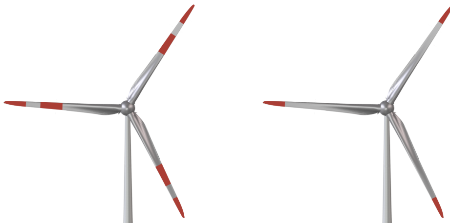
Abb. 3: Farbliche Kennzeichnung Rotorblatt

Zur farblichen Kennzeichnung der Rotorblätter werden 3 jeweils 6 m breite Streifen in den Farbtönen Verkehrsrot (RAL 3020), Achatgrau (RAL 7038) und Verkehrsrot (RAL 3020) oder ein 6 m breiter Streifen in Verkehrsrot (RAL 3020) angebracht.