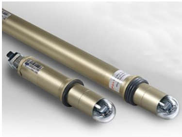
Abb. 2: Befuerungsleuchte Turm

Durch behördliche Vorschriften kann eine Befuerung des Turms gefordert werden. Dazu wird der Turm mit einer, seltener mit zwei Befuerungsebenen mit jeweils 4 Stableuchten ausgerüstet. Eine Nachrüstung von Leuchten am Turm ist nur mit sehr hohem Aufwand möglich.