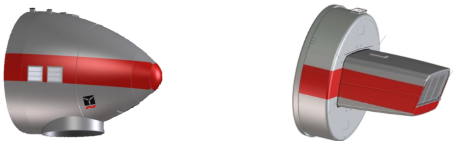
Abb. 4: Farbliche Kennzeichnung Gondel, Tropfenform (links), Kompaktform (rechts)

Zur farblichen Kennzeichnung der Gondel wird an der Gondel ein Farbstreifen in Verkehrsrot (RAL 3020) angebracht.