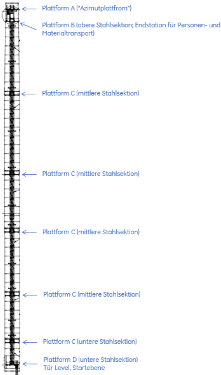
Abbildung 3: Übersicht der Turmplattformen im Stahlrohrturm