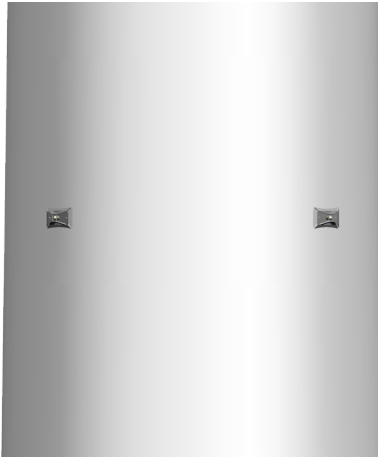
Abb. 2: Befuerungsleuchte am Turm

Durch behördliche Vorschriften kann eine Befuerung des Turms gefordert werden. Dazu wird der Turm mit einer, seltener mit zwei Befuerungsebenen mit jeweils 4 Standleuchten ausgerüstet. Eine Nachrüstung von Leuchten am Turm ist nur mit sehr hohem Aufwand möglich.