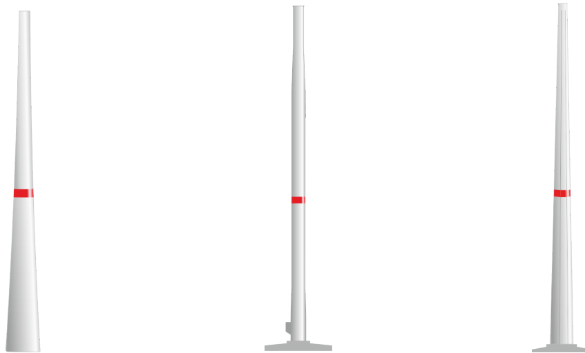
Abb. 5: Farbliche Kennzeichnung am Turm, beispielhafte Darstellung

Zur farblichen Kennzeichnung wird ein 3 m hoher Farbstreifen in 40 m \pm 5 m Höhe am Turm angebracht.