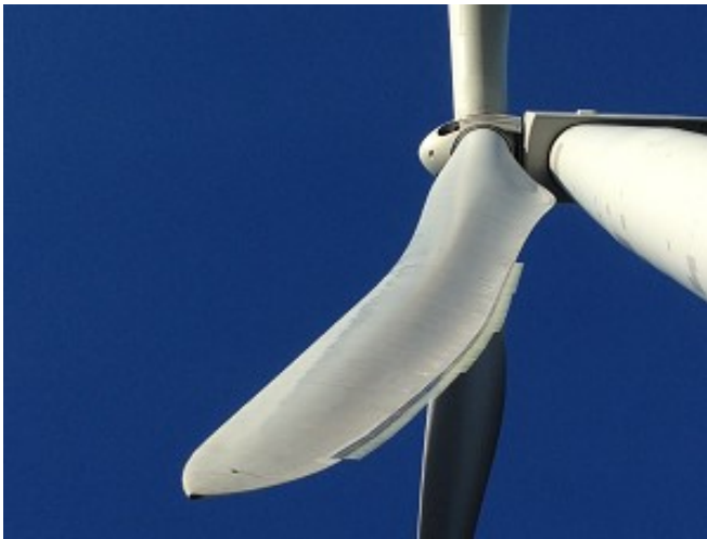
Abb. 1: Serrations (gezackte Blatthinterkanten) an einer WEA

AZur Optimierung der Schalleistung werden die Rotorblätter mit geräuscharmen Blatthinterkanten (Serrations) ausgerüstet, deren Anbringung auf der Druckseite der eigentlichen Blatthinterkante erfolgt. Diese Serrations sind dünne, gezackte Kunststoffleisten. Die Rotorblätter der 5.5-158 werden mit diesen Leisten bereits ab Werk ausgerüstet.