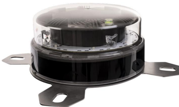
Abbildung 2-1: Gefahrenfeuer AL L240-GFW-IRG-G-BR 10M

Dieses Dokument beschreibt die Gefahrenfeueroption für Vestas-Windenergieanlagen. Die von Vestas gelieferten Gefahrenfeuer sind vollständig in die Elektrik und das SCADA-Überwachungssystem integrierte mechanische Montageoptionen.