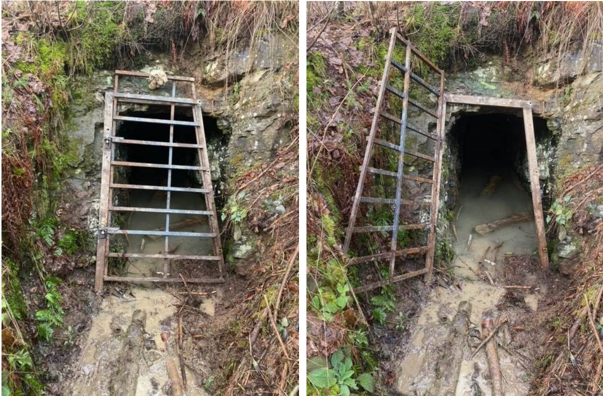
Abbildung 11: li. Stollen mit geschlossenem Gitter, re. Stollen mit offenem Gitter (Fotos M. Jaeger)

Nachtrag 2: Samstag, 13. März 2021 erfolgte die Kontrolle des Stollens auf Fledermausbesatz. Ein Nachweis von Fledermäusen gelang nicht.