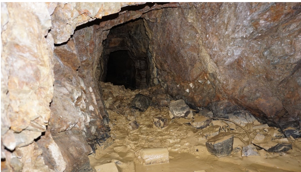
Abbildung 4: Abzweig linker Tunnelgang