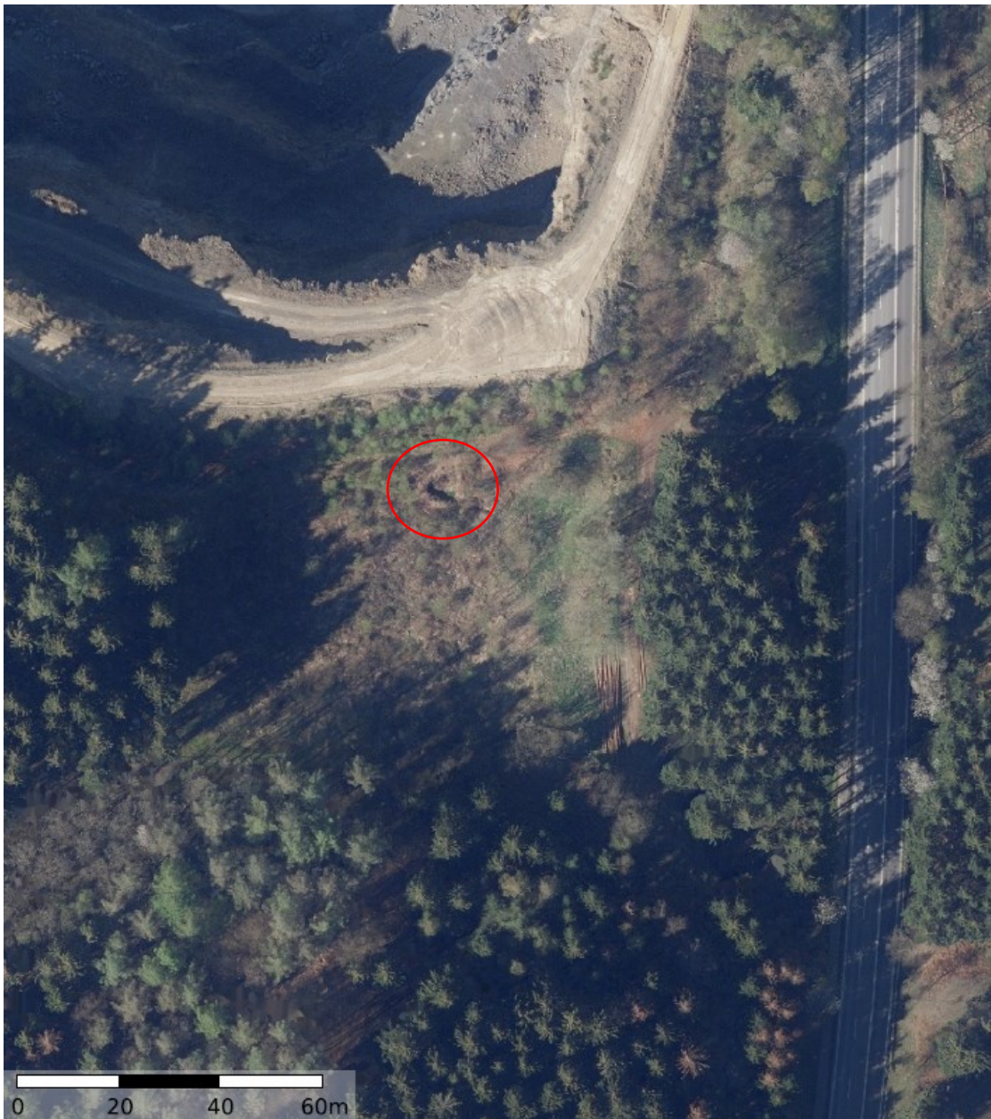
Abbildung 1: Luftbild mit Lage des Stollens, roter Kreis

Am 25. Juli 2020 erfolgte die Begehung des Stollens am Steinbruch Jaeger. Die Lage des Stollens wurde in Abbildung 1 mit einem roten Kreis gekennzeichnet. Die Länge