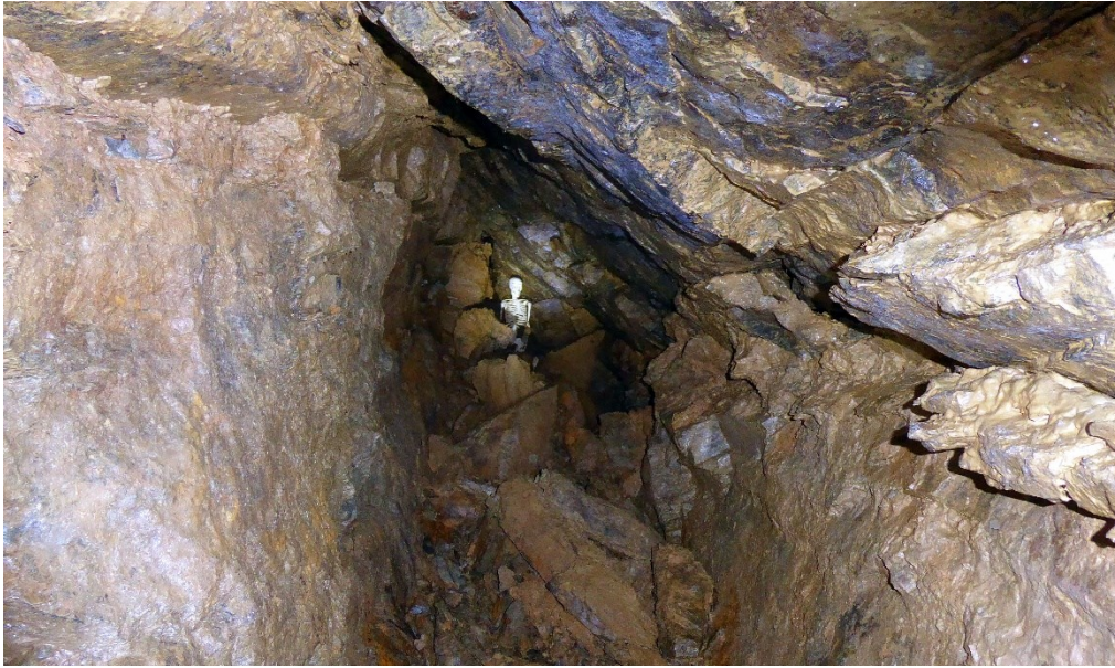
Abbildung 8: Ende des rechten Tunnelgangs mit vielen Spalten und Rissen im Gestein