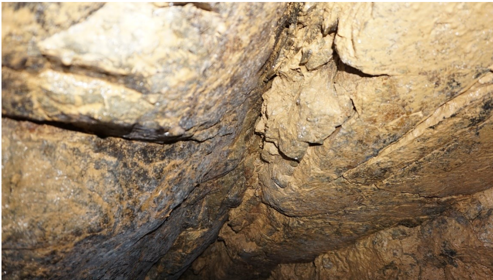
Abbildung 9: Rauhe Decke im anstehenden Grauwacke Gestein