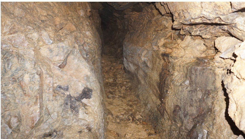
Abbildung 7: Blick in rechten Tunnelgang