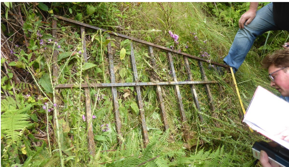
Abbildung 10: Gitter des Stollens