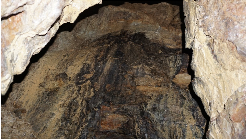
Abbildung 5: Linker Tunnelgang, Blick in Kammer mit Höhenbruch