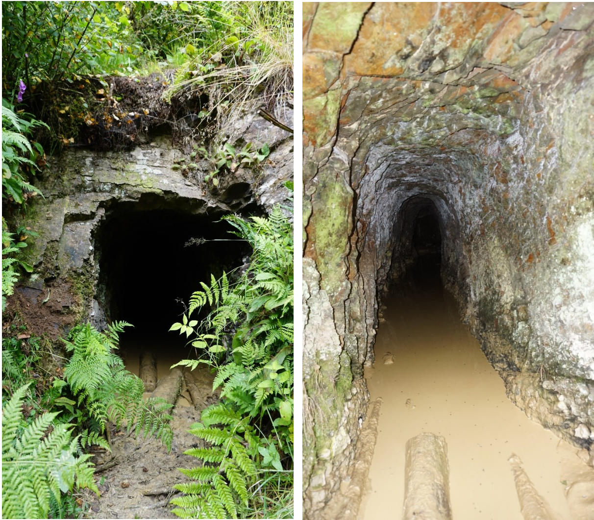
Abbildung 3: links Mundloch, recht Blick von Mundloch in Stollengang