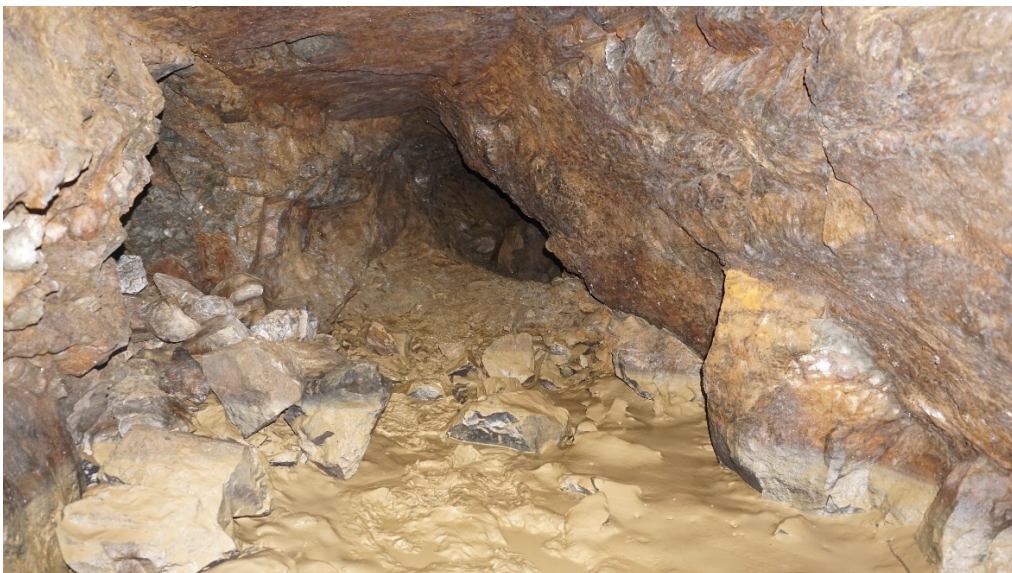
Abbildung 6: Ende Linker Tunnelgang mit Gestein und Geröll