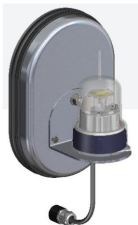
Abbildung 4-3: Turmbeleuchtung (L92-AVV-ES)