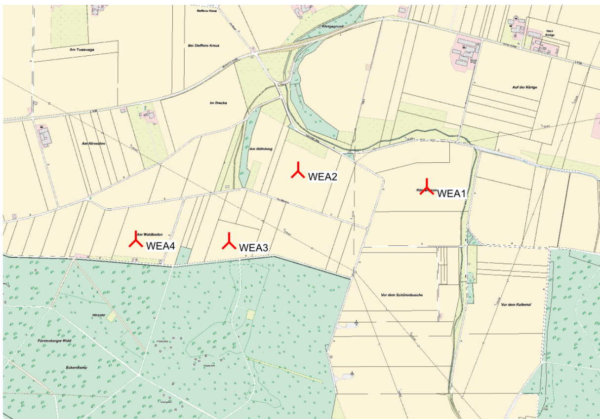
Abbildung 2: Übersichtskarte des geplanten WEA-Standorts im Maßstab 1 : 10.000