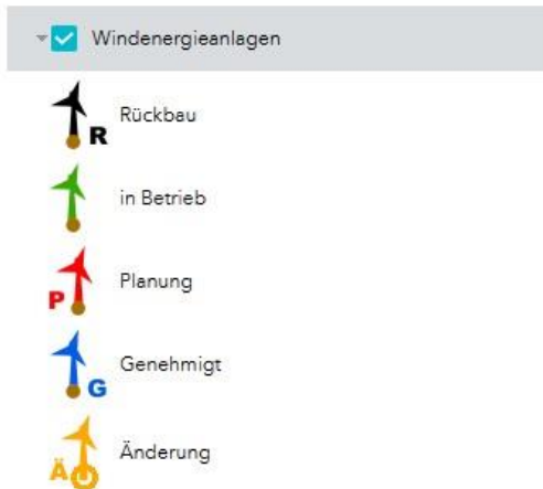
Abbildung 2 Legende des Status der Windenergieanlagen aus Abbildung 2

Die Dominik und Janina Wloka GbR wurde beauftragt, auf Grundlage vorliegender Gutachten sowie den tatsächlichen örtlichen Begebenheiten zu beurteilen, ob das Vorhaben zu einer erheblichen Beeinträchtigung der Erhaltungszustände der maßgeblichen Bestandteile der umliegenden Flora-Fauna-Habitat-Gebiete (FFH-Gebiete) führt.