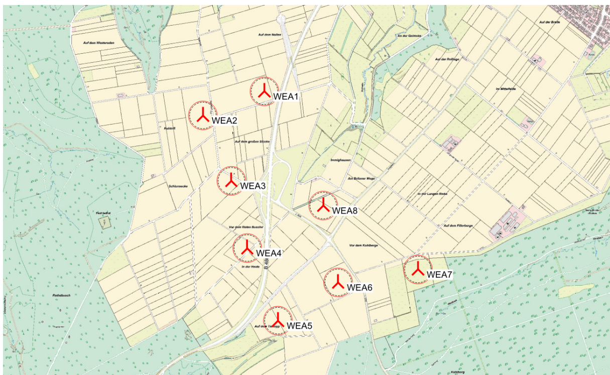
Abbildung 2: Übersichtskarte des geplanten WEA-Standorts im Maßstab 1 : 10.000