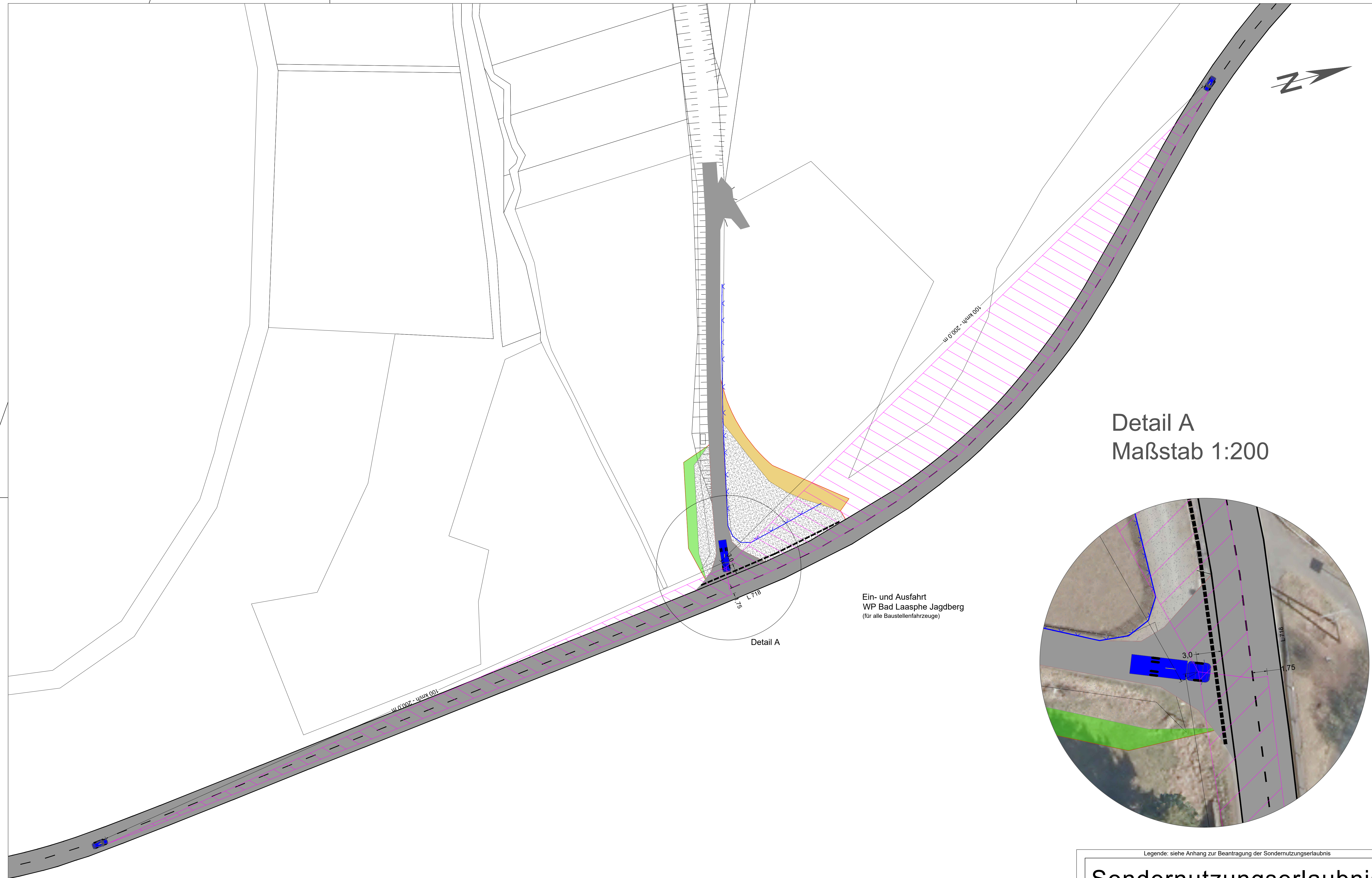
Detail A Maßstab 1:200

Ein- und Ausfahrt WP Bad Laasphe Jagdberg (für alle Baustellenfahrzeuge)