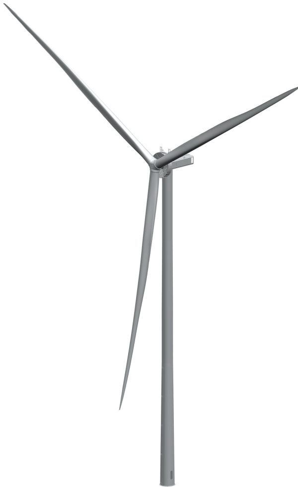
Abb. 1: Produktübersicht

Die Windenergieanlage erzeugt elektrische Energie aus Wind. Der anströmende Wind bewirkt, dass der Rotor sich im Uhrzeigersinn dreht. Die Drehbewegung wird in elektrische Energie umgewandelt. Die Windenergieanlage arbeitet automatisch.