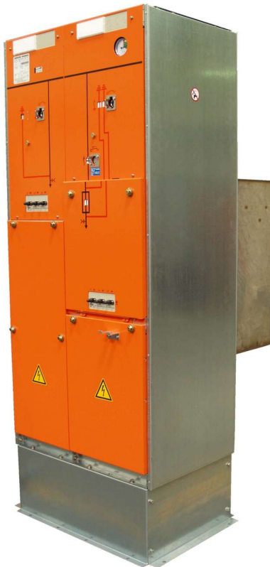
Abb. 3: Beispiel einer 2-feldigen Schaltanlage