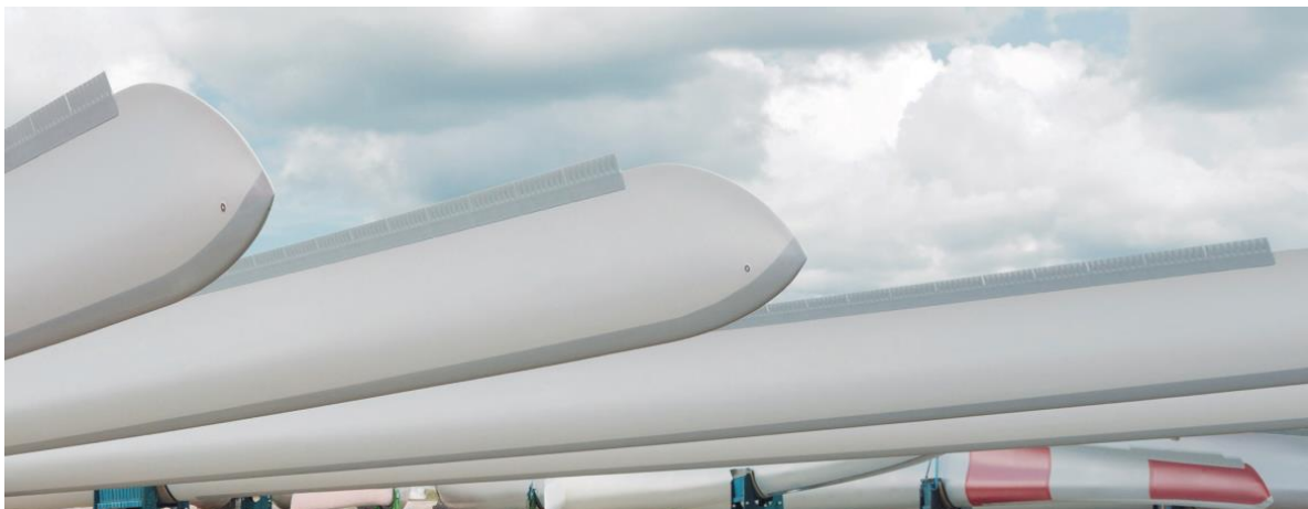
Abbildung 3: DinoTails® an transportbereiten Rotorblättern