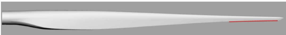
Abbildung 2: Beispielhafte Position von DinoTails® an einem Rotorblatt

DinoTails® sind thermoplastische Spritzgussteile aus einem polymeren Verbundwerkstoff. Sie werden an der Hinterkante im äußeren Bereich des Rotorblattes mithilfe eines elastischen Klebers befestigt, weil dort die Schallemissionen am höchsten sind.