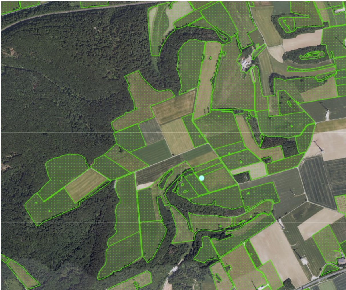
Abbildung 1: Grünlandkomplex am Keimberg (Dauergrünland grün, Anlagenstandort türkis)

Die ausgedehnten Grünlandbereiche am geplanten WEA-Standort sowie im Umfeld des Vorhabens stellen als Nahrungshabitats für den Rotmilan eine zwingende Ergänzung der Waldlebensräume (Bruthabitats) dar (s. Abb. 1).