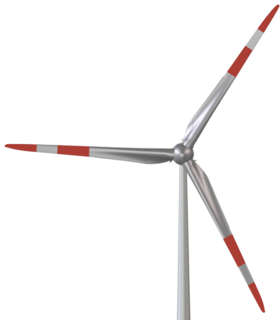
Abb. 3: Farbliche Kennzeichnung am Rotorblatt, beispielhafte Darstellung

Zur farblichen Kennzeichnung werden 6 m breite Streifen an den Rotorblättern angebracht.