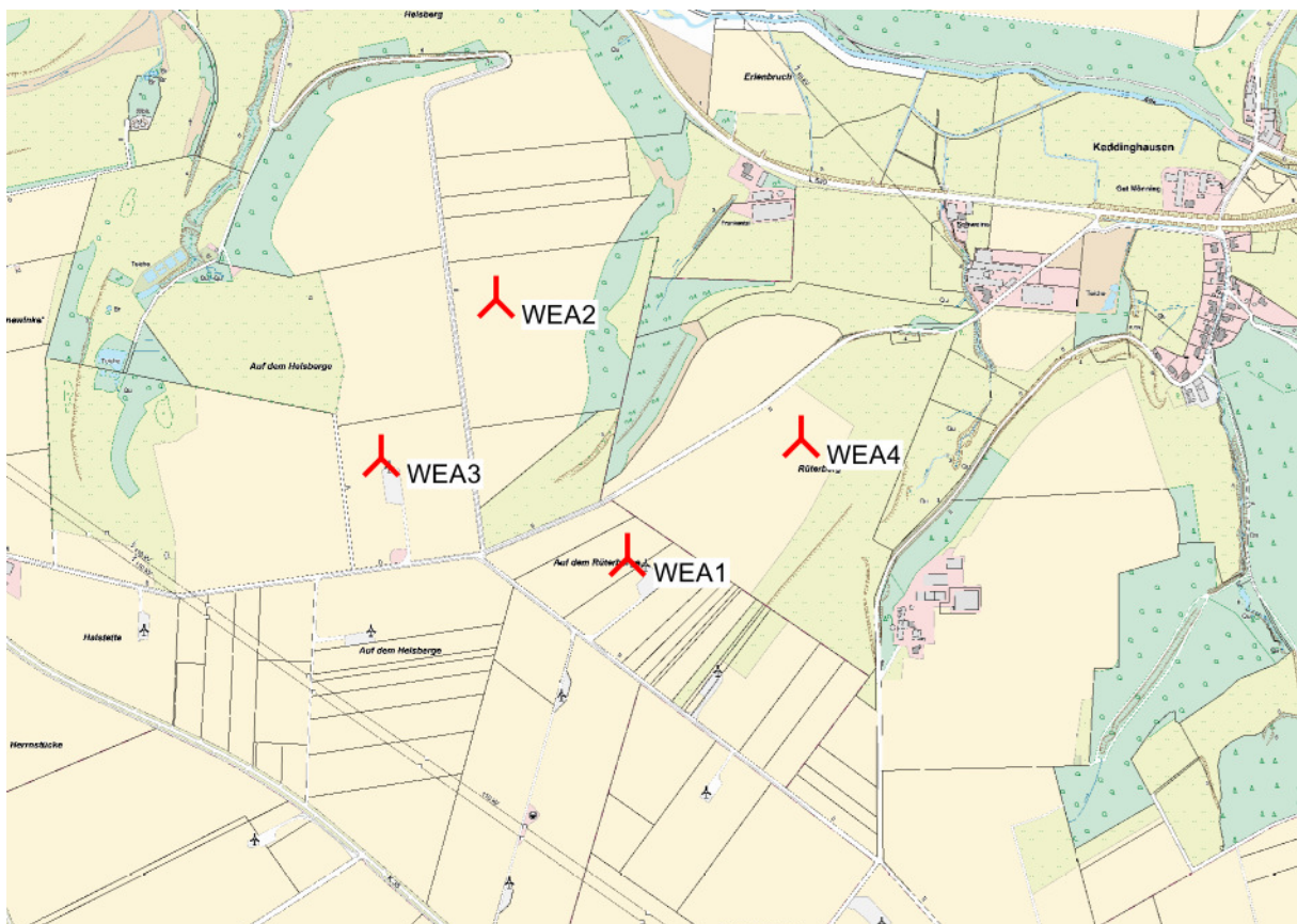
Abbildung 2: Übersichtskarte des geplanten WEA-Standorts im Maßstab 1 : 10.000