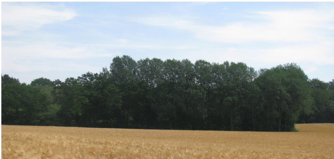
Foto 18: Biotop 10 - Birkenmoorwald im „Haselholz“ - Blick von Nordwest (Pfeifengras-Hochstauden-Stadium der Sauer-Zwischenmoore B 0406-433B4049)