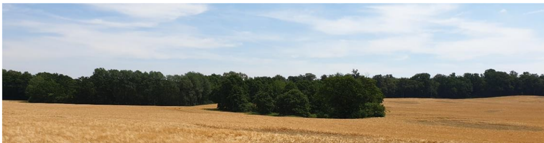
Foto 21: Blick auf Feldgehölz/Feuchtgebüsch mit Kleingewässer innerhalb der Ackerflur (Biotop 11) , im Hintergrund östlich an die Vorhabensfläche angrenzender Waldbestand (Haselholz) mit Birkenmoorwald (Biotop 10)