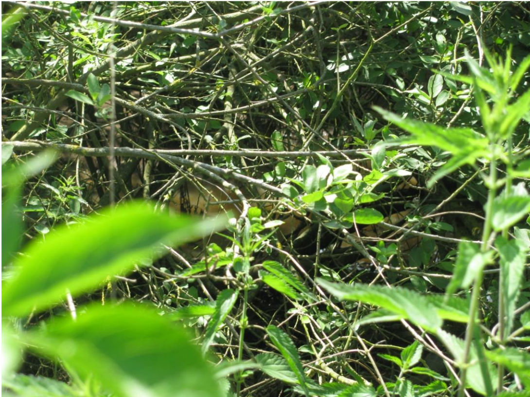
Foto 10: Blick auf westlichen Bereich des Biotopes 7 - Kleingewässer