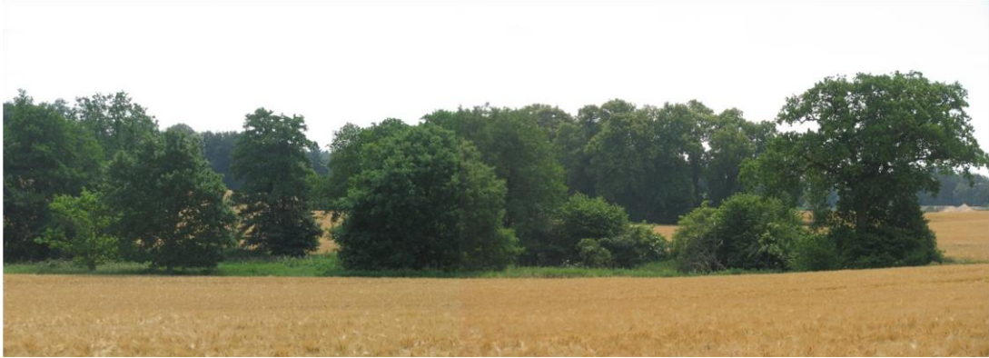
Foto 22: Biotop 11 - Feldgehölz/Feuchtgebüsch mit Kleingewässer innerhalb der Ackerflur - von Nord nach Süd (naturnahes Feldgehölz B 0406-344B5110/ Kleingewässer B 0406-344B5109)