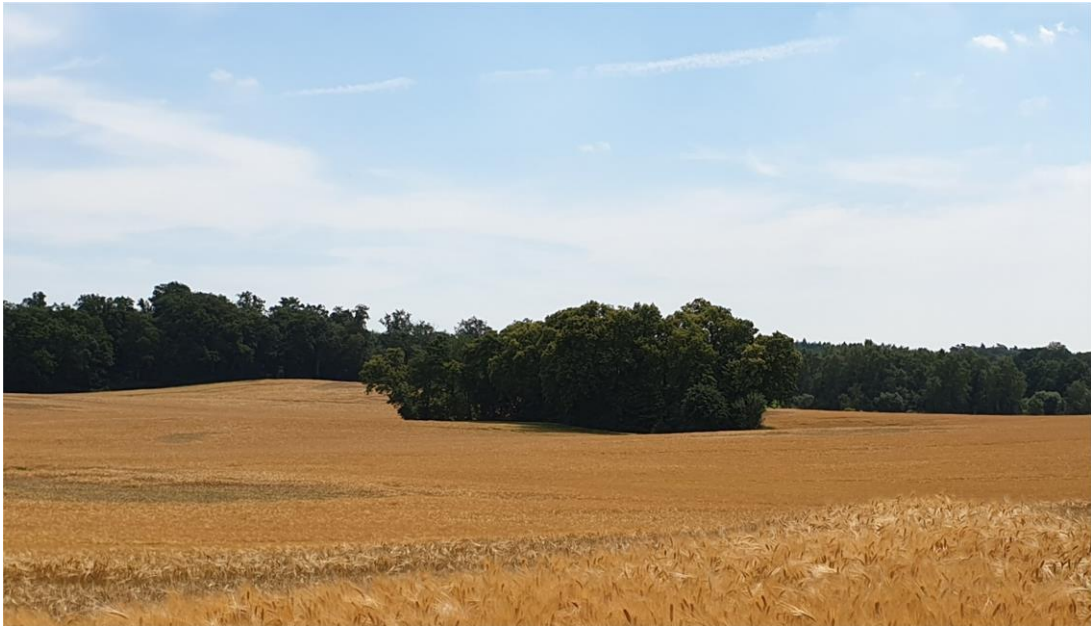
Foto 14: Blick auf Biotop 8 - Soll/Kleingewässer mit Baum- und Gehölzbestand isoliert innerhalb der Ackerflur - Blick von Nordwest nach Südost (Soll/Kleingewässer B 0406-344B5103)