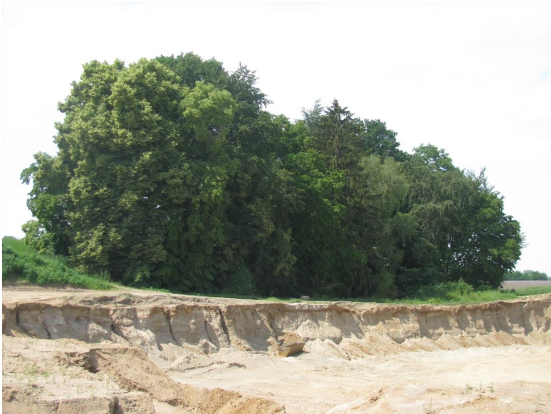
Foto 5: Biotop 5 - Feldgehölz - Blick von Nordost nach Südwest (naturnahes Feldgehölz B 0406-344B5081)