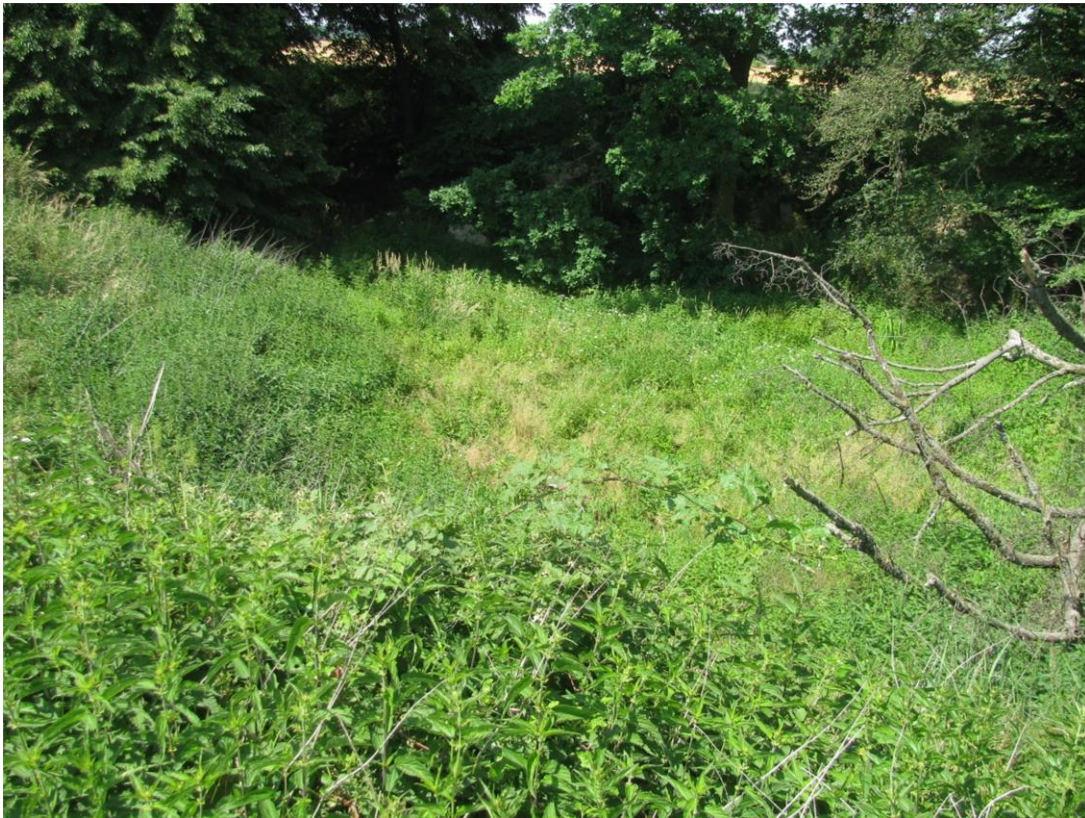
Foto 16: Biotop 8 - Soll/Kleingewässer - Südostseite baumlos, trocken