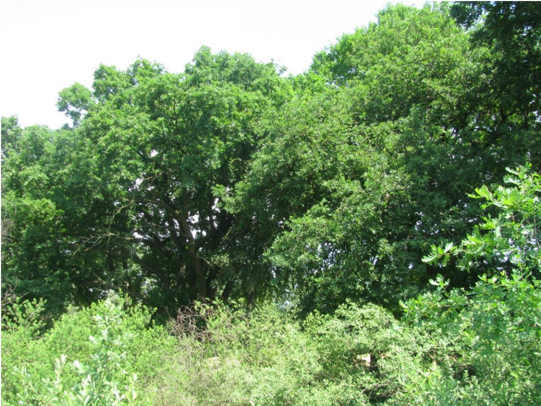
Foto 26: Feldgehölz im östlichen Teil Biotop 11 - Altbaum-und Gehölzbestand