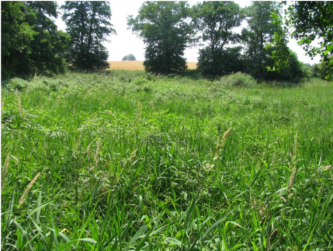
Foto 24: Kleingewässer im westlichen Teil Biotop 11 - von Nord nach Süd