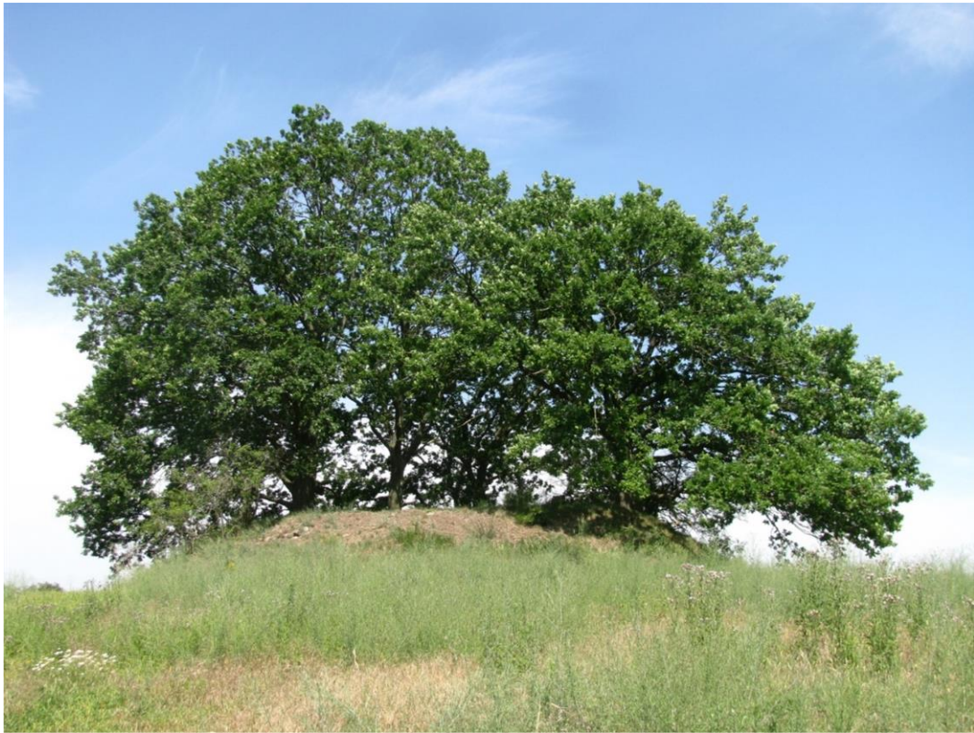
Foto 1: Biotop 2 - Hügelgrab - Blick von Nord nach Süd (naturnahes Feldgehölz B 0406-344B5082)