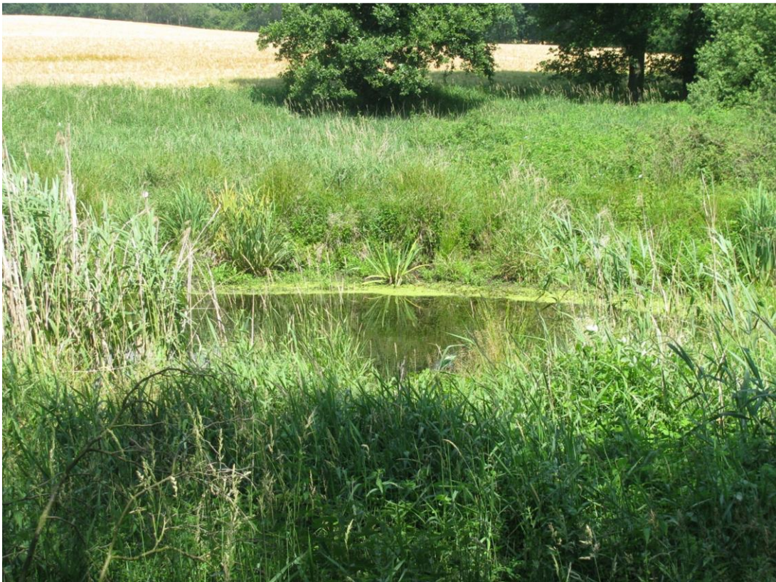
Foto 23: Kleingewässer im nordwestlichen Teil Biotop 11 - von Süd nach Nord - baumlos, mit (kleinflächig) offener Wasserfläche und Hoch-/Staudenflur