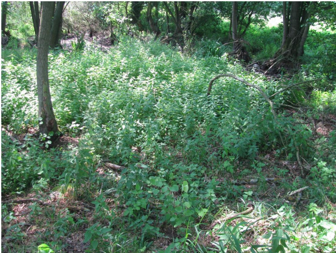
Foto 25: Feldgehölz im östlichen Teil Biotop 11 - trocken/wechselfeucht mit Altbaum- und Gehölzbestand