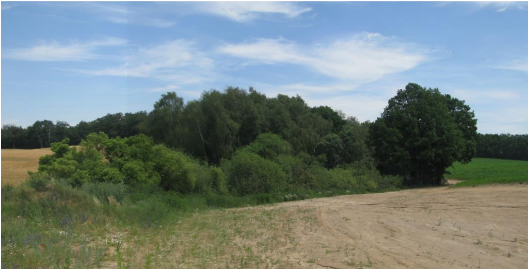
Foto 7: Biotop 7 - Feldgehölz mit mehreren Kleingewässern - Blick von West nach Ost (naturnahes Feldgehölz B 0406-344B5094/stehendes Kleingewässer B 0406-344B5093)