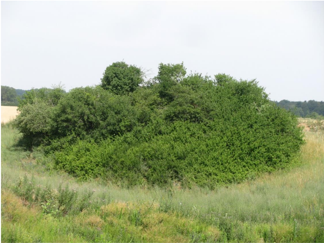
Foto 3: Biotop 3 - Hügelgrab - Blick von Nord nach Süd (naturnahes Feldgehölz B 0406-344B5088)