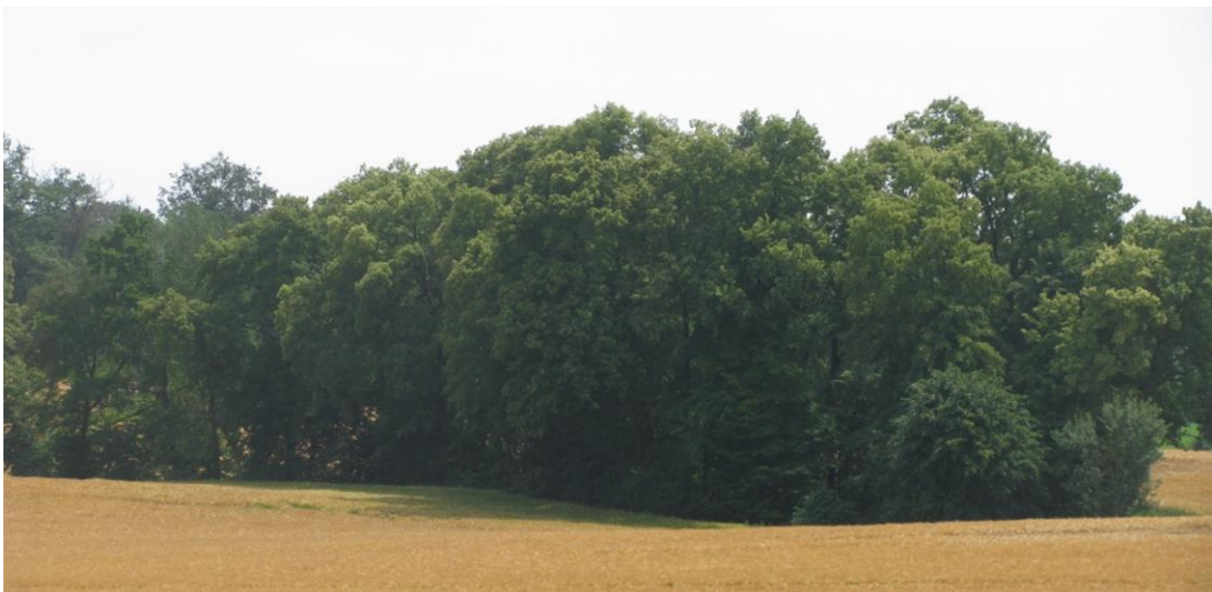
Foto 16: Biotop 8 - Soll/Kleingewässer mit Baum- und Gehölzbestand - Blick von Nordwest