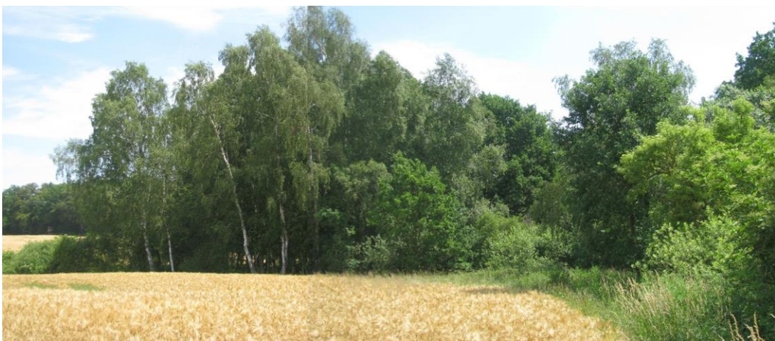
Foto 9: Blick auf den nordöstlichen Bereich Biotop 7 – Feldgehölz - von West nach Ost