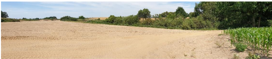
Foto 8: Blick auf den aktuell nördlichen Tagebaurand (Bereich der wiedernutzbaregemachten Fläche mit Beendigung der Bergaufsicht) - daran nördlich angrenzend – Biotop 7 - Feldgehölz mit mehreren Kleingewässern - von Süd nach Nord