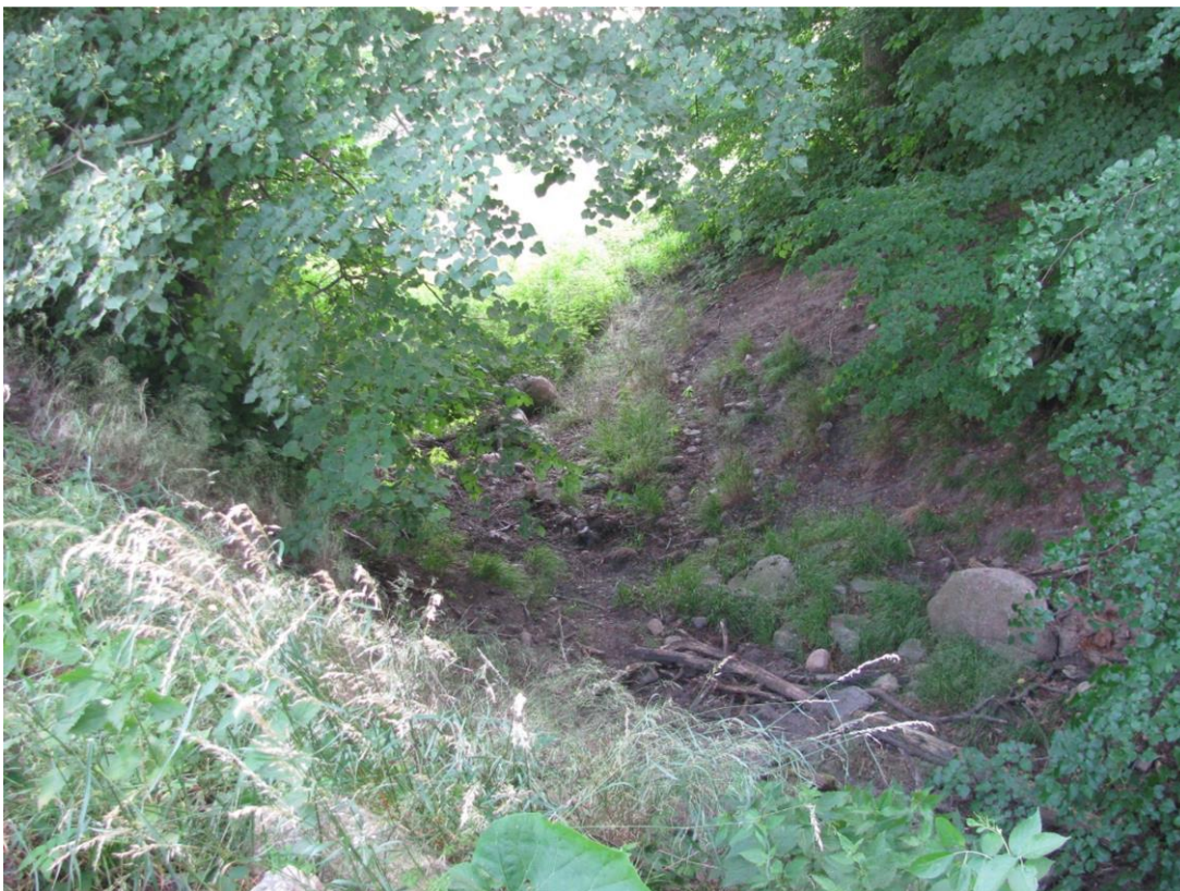
Foto 17: Biotop 8 - Soll/Kleingewässer - Blick von Süd nach Nordwest, trocken