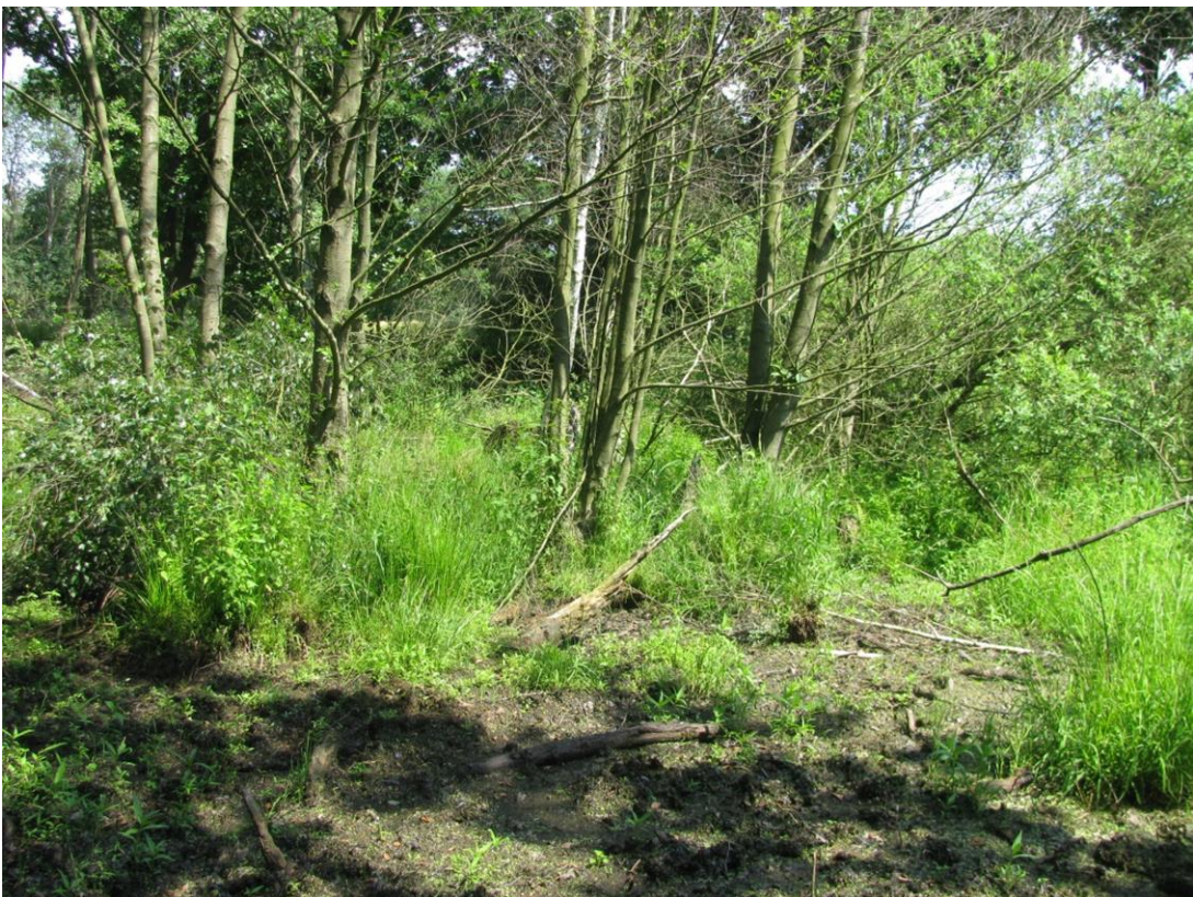
Foto 27: Feldgehölz im östlichen Teil Biotop 11 - trocken/wechselfeucht