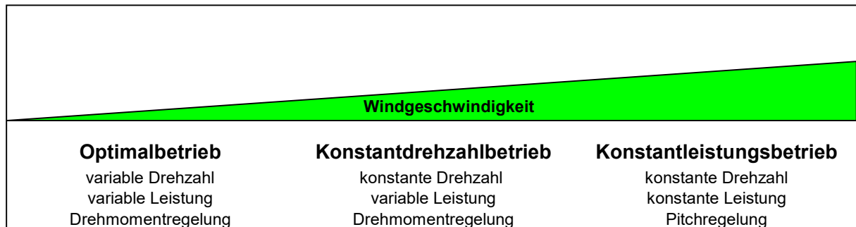
Abbildung 7-1: Regelbereiche

Entsprechend den vorherrschenden Windbedingungen lässt sich der Betriebsbereich der Windturbine in drei Teile untergliedern. Jedem dieser Betriebsbereiche sind entsprechende Regelungsaufgaben in Bezug auf Drehzahl und Leistungsregelung zugeordnet.