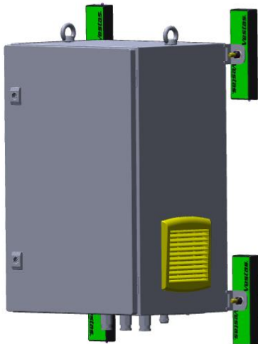
Abbildung 1 – USV-Option für Gefahrenfeuer – Anbringung

Die USV-Option für Gefahrenfeuer wird mit allen erforderlichen Montage- und Installationselementen ausgeliefert. Die USV-Option für Gefahrenfeuer wird mit Magneten am Turm befestigt.