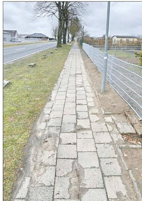
Noch nicht sanierter Bereich