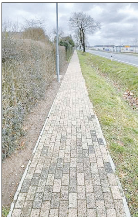
Durch den Bauhof schon sanierter Bereich des Gehweges nördlich der Rostocker Chaussee

Als Alternative steht der Gehweg nördlich der B110 zur Verfügung. Dieser wurde in den letzten zwei Jahren durch den städtischen Bauhof abschnittsweise saniert. Es wird geprüft, ob die noch nicht sanierten Bereiche des Gehweges noch in diesem Jahr, über eine außerplanmäßige Bereitstellung von Mitteln, durch eine Fachfirma ausgebaut werden kann.