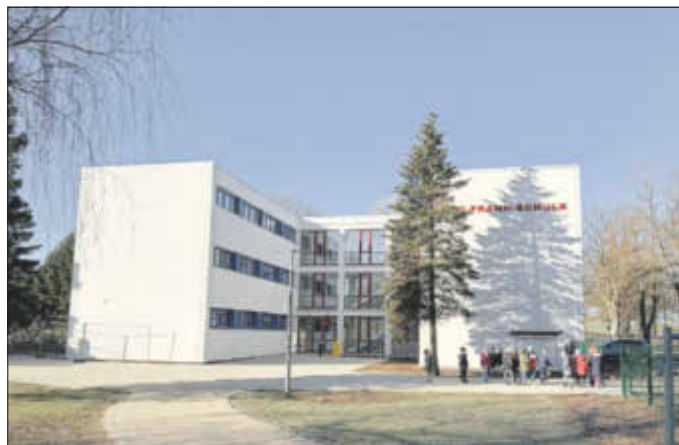
Haus 1 - Grundschulteil