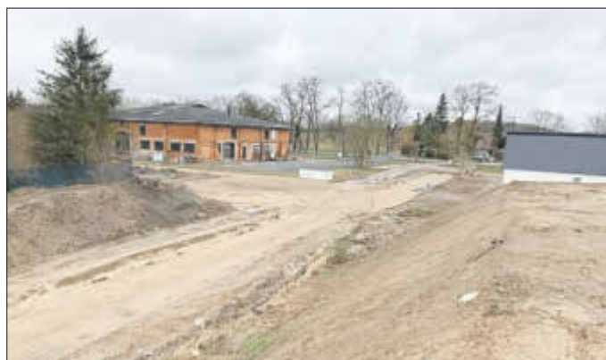
Erschließung Wohngebiet „Am Recknitzpark“ Blick auf die Notzufahrt

Die Arbeiten für die Erschließung des neuen Wohngebietes „Am Recknitzpark“ sollen bis Mai 2021 abgeschlossen werden. Somit besteht voraussichtlich ab Juni Hochbaureife für die Bauwilligen.