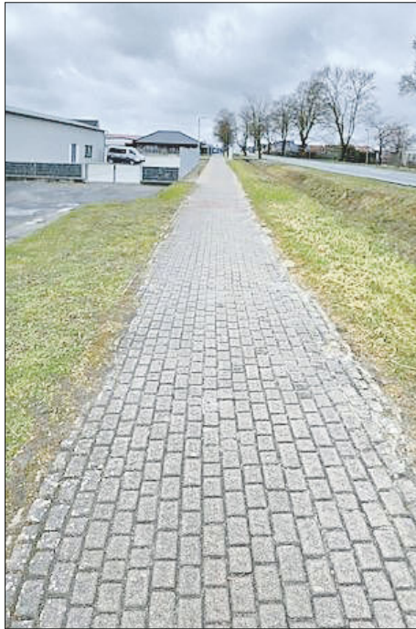
Radweg südlich der Rostocker Chaussee

Dennoch wurde festgehalten, dass die Oberfläche, gezeichnet durch das „Rumpelpflaster“, nicht so befahrbar ist, wie ein ausgebauter Weg mit einem ebenen Material.