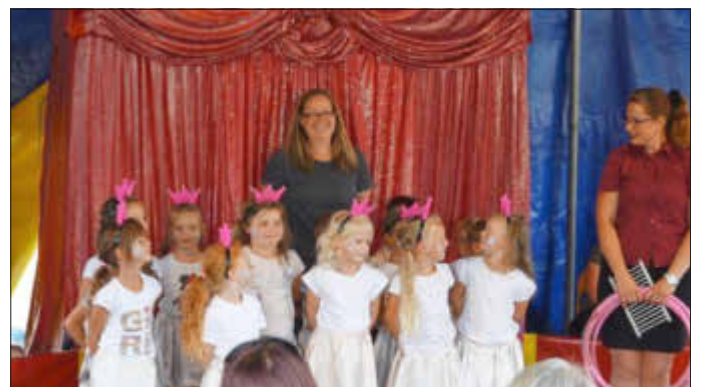
Euer Kita Sankt Martin Team

Wir Erzieher sind sehr stolz auf unsere kleinen Artisten, denn es ist nicht selbstverständlich vor so einem großen Publikum aufzutreten. Viele Erwachsene hätten sich das nicht getraut!!! Die Aufführung war ein großer Erfolg und alle Artisten beider Kitas bekamen zum Abschluss in der Manege einen großen Applaus vom Publikum. Ein großer Dank richtet sich an die Kirchgemeinde, die uns ihren Kirchenbus für diese Woche zur Verfügung stellte. Natürlich verfolgten wir in den letzten Monaten auch weiterhin unsere BNE-Projekte und sind jetzt schon fast am Ende unserer Zertifizierung angelangt. Nun nähern wir uns mit großen Schritten dem Herbst und dem diesjährigen Erntedankfest und beginnen mit den Vorbereitungen. Am 01.10.2021 werden wir mit den Kindern wieder einen Erntedankgottesdienst durchführen und die Kirche für den Gemeindegottesdienst am 03.10. feierlich dekorieren. Unsere Kinder freuen sich jetzt schon sehr darauf.