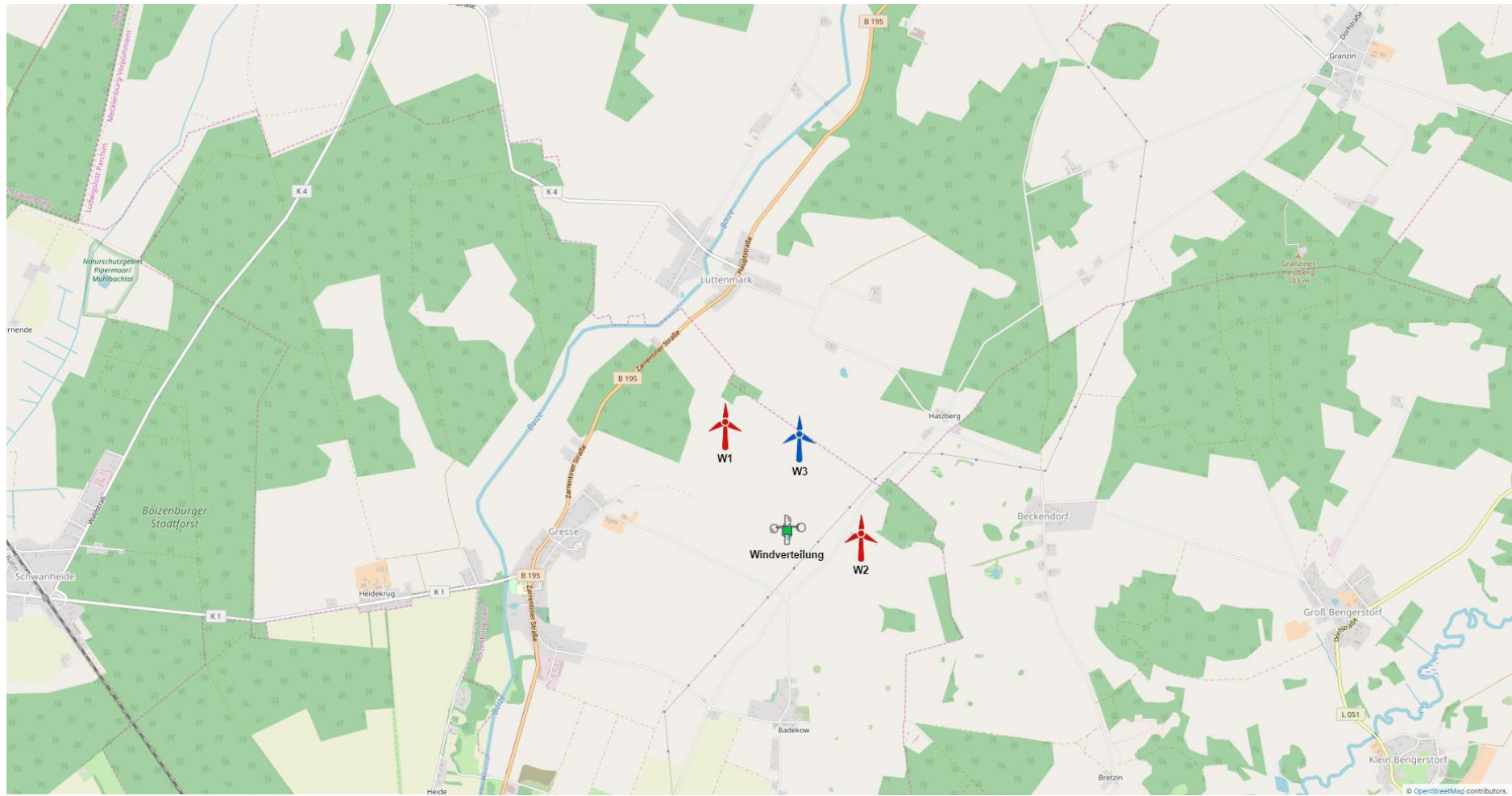
Abbildung 2.1: Zu untersuchende Windparkkonfiguration; Kartenmaterial: [19.1, 19.2]