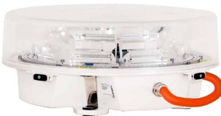
Abbildung 2-1: Gefahrenfeuer AL L550-GFW-ES-IRG-G 20M

Dieses Modell ist für den Einsatz in Deutschland ausgelegt und erfüllt die Anforderungen der Allgemeinen Verwaltungsvorschrift zur Kennzeichnung von Luftfahrthindernissen (AVV Kennzeichnung) vom 24.04.2020.