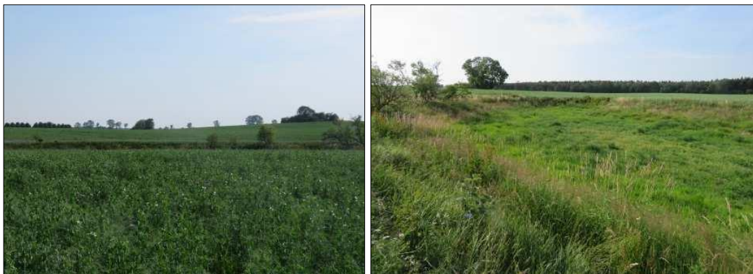
Abbildung 4: Ackersoll Nr. 33 (NANU GmbH 2019)

Bezeichnung gemäß Kartenportal Umwelt M-V: temporäres Kleingewässer, undiff. Röhricht Laufende Nummer im Landkreis: PCH08102