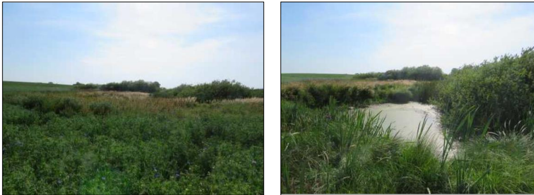
Abbildung 2: Ackersoll Nr. 31 (NANU GmbH 2019)

Das Kleingewässer liegt in einer vermoorten Senke innerhalb der intensiv genutzten Ackerflächen. Bei dem östlich gelegenen Ackersoll wurde im Kartierzeitraum eine temporäre Wasserführung festgestellt. Das vorhandene temporäre Kleingewässer ist durch direkte Einträge aus der unmittelbar angrenzenden intensiven Ackernutzung relativ nährstoffreich und wurde dem Biotoptyp SE - Nährstoffreiches Stillgewässer zugeordnet. Die Ufervegetation wird von Ruderalgebüsch ( BLR ), z. T. mosaikartige Beständen von Sumpfreitgras ( VGS ), Rasigem Großseggenried ( VGR ), Schilf-Landröhricht ( VRL ), Sonstigem Feuchtgrünland ( GFD ) mit Brenndolden und Ruderalfluren ( RHU ) gebildet.