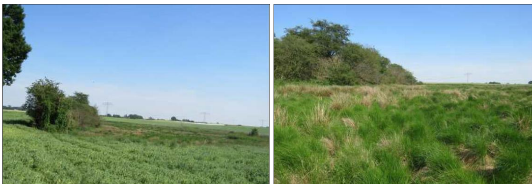
Abbildung 3: Ackersoll Nr. 32 (NANU GmbH 2019)

Die Senke dieses Inselbiotops ist umgeben von intensiv genutzten Ackerflächen und weist eine markante Böschung auf, die im Norden durch eine Feldhecke ( BHB ) mit Lesesteinhaufen ( XGL ) begrenzt ist. Durch die Mitte der Senke verläuft ein periodisch wasserführender schmaler Graben ( FGX ). Die Randbereiche der Senke sowie der größte Teil der Biotopflächen südlich des Grabens sind mit artenarmen, teilweise eutrophen Gras- und Hochstaudenfluren und