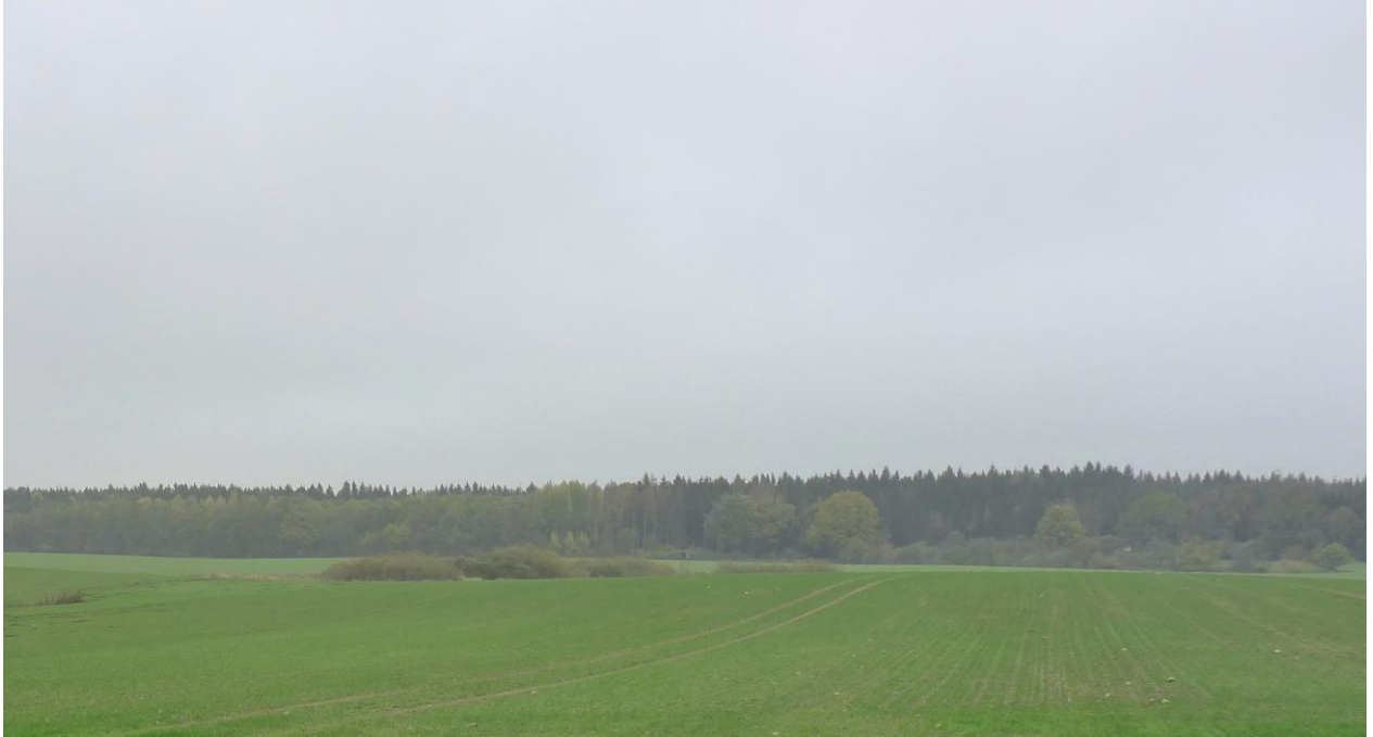
Standort der geplanten WEA bei Granzin (BPR 2019)