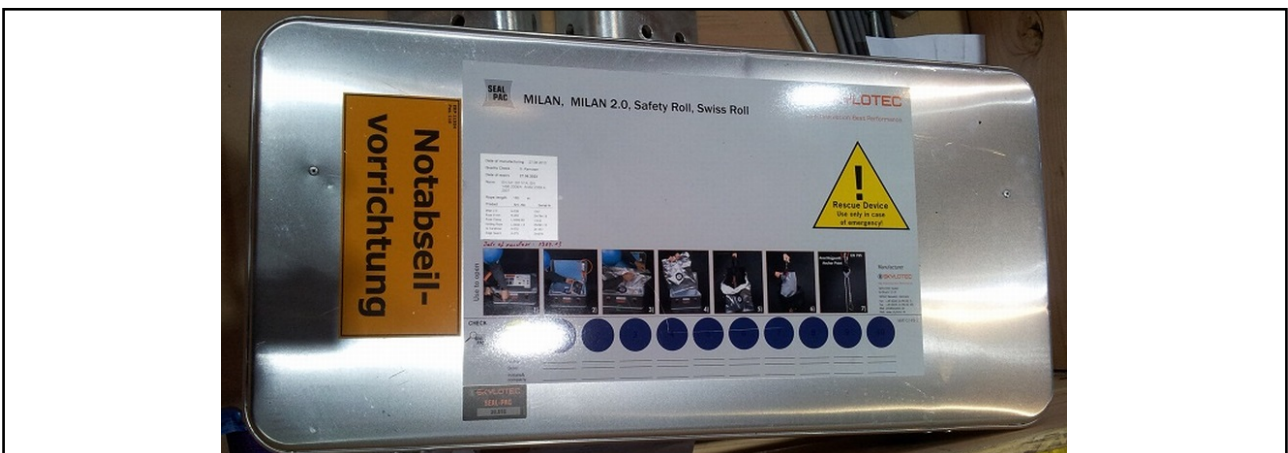
Abb. 3: Notabseil-ausrüstung in der WEA