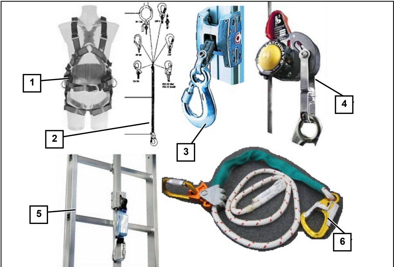
Abb. 2: Beispiele für Teile der persönlichen Fallschutzausrüstung