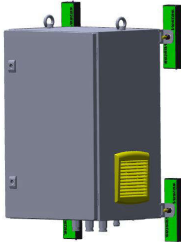
Abbildung 1 – USV-Option für Gefahrenfeuer – Anbringung

Die USV-Option für Gefahrenfeuer wird mit allen erforderlichen Montage- und Installationselementen ausgeliefert. Die USV-Option für Gefahrenfeuer wird mit Magneten am Turm befestigt.