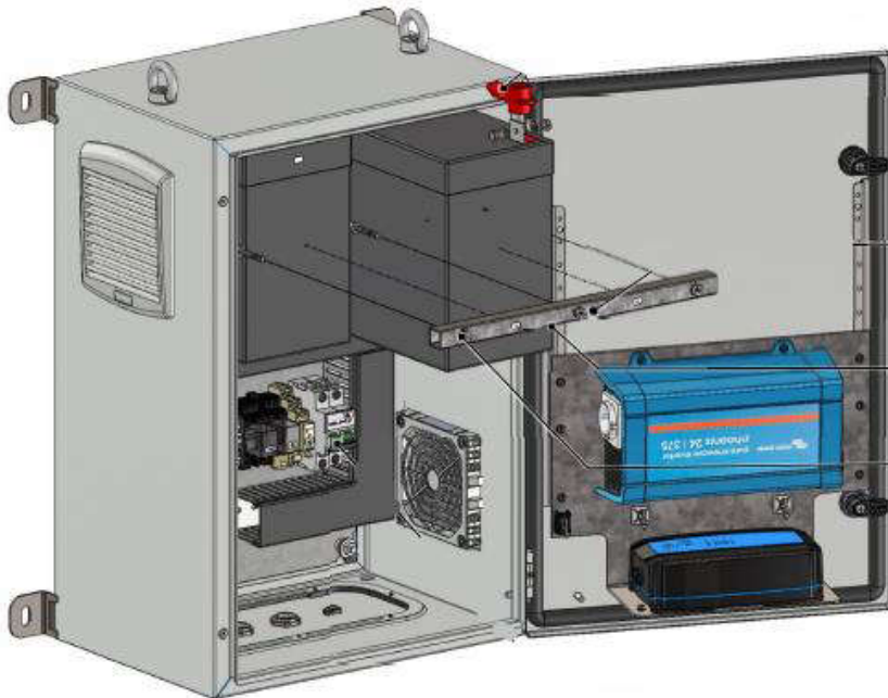
Abbildung 1 – USV-Option für Gefahrenfeuer

Dieses Dokument beschreibt die USV-Option für Gefahrenfeuer (Aviation Light Optional UPS) für Vestas-WEA. Die durch Vestas gelieferte USV-Option für Gefahrenfeuer ist vollständig in das elektrische System der WEA integriert.