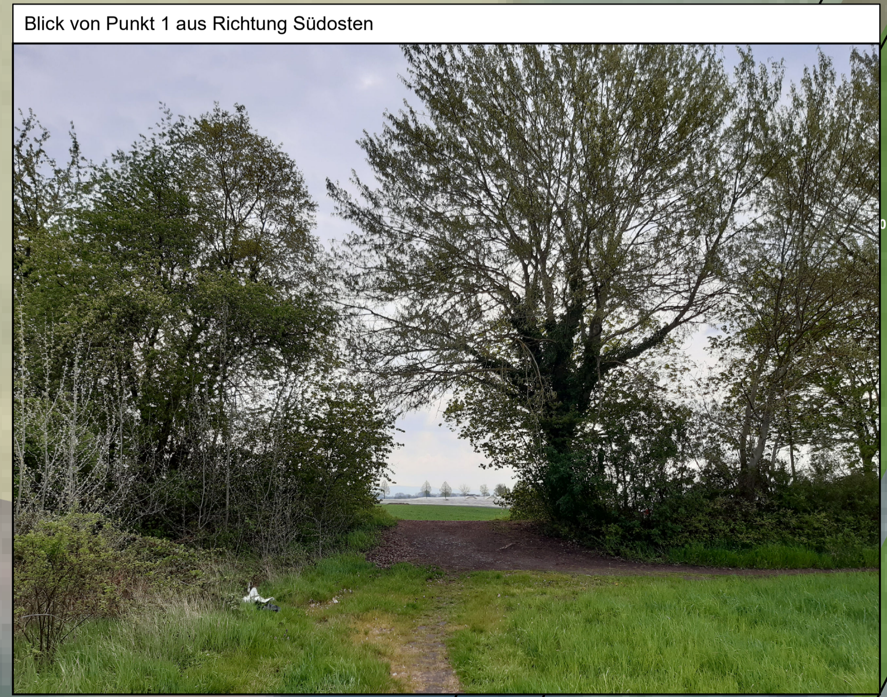
Blick von Punkt 1 aus Richtung Südosten

D:\Projekte\2018\05820_BUE\06_Grundlagen für Fachplanungen\Antrag_Waldumwandlung\Waldumwandlung.mxd