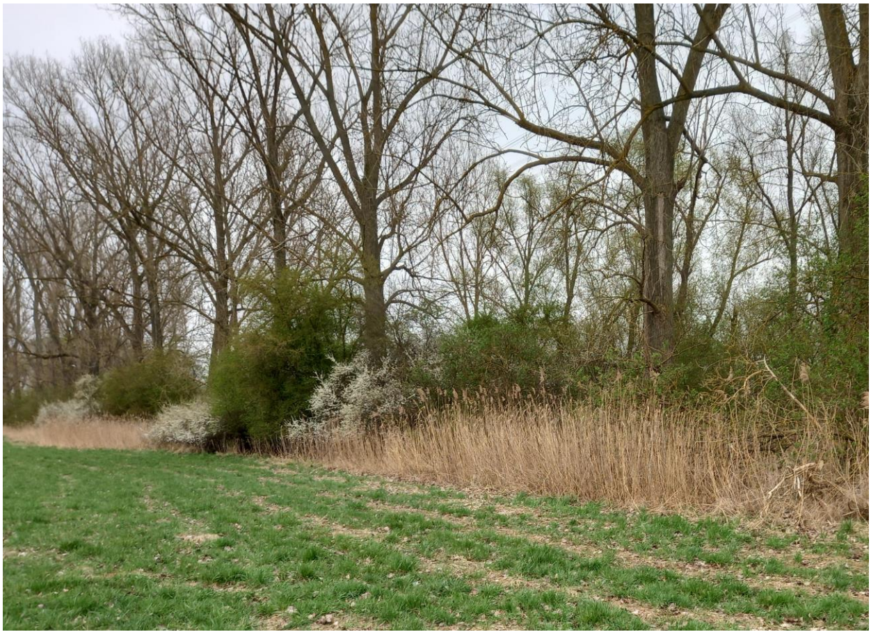
Abbildung 1: Blick nach Südosten parallel der Bahnlinie und der Hybridpappeln, die entlang eines weitgehend verlandeten Grabens von Röhricht und Gebüsch gesäumt werden.

Die Vegetation der in Verlandung begriffenen Entwässerungsgräben besteht im Gebiet, je nach Wasserführung, aus Röhricht (dominierend Schilf ( Phragmites australis ), Rohrglanzgras) mit ruderalen Anteilen, häufig Brombeere ( Rubus fruticosus ), Brennnesseln, Disteln ( Cirsium spec. ), meist aus einer Mischung und je nach Räumungsintensität (Gräben) auch im Wechsel mit Gehölzen, häufig Weiden- oder Prunus-Arten. Im Süden (s. Abb. 1) erstreckt sich ein Schilfband als Saum entlang des Pappelbestandes, der selbst in/an einem (kaum mehr existenten) Graben steht. Im Norden der Abbaufäche Südost nahe dem aktuell in Umsetzung