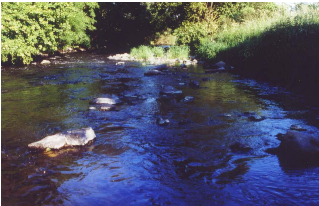
Bild 1: Charakteristischer Abschnitt für die ökologische Funktionseinheit II im Bereich der Probestelle 2. Struktureiche Uferlinie sowie heterogenes Sohlsubstrat mit verschiedensten Strömungsverhältnissen.