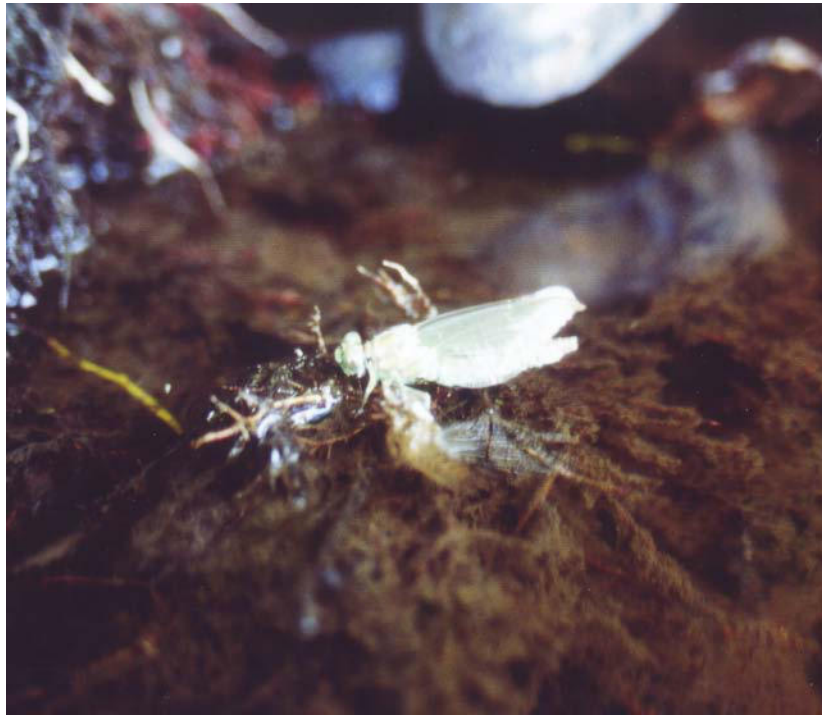
Bild 2: Schlüpfende Kleine Zangenlibelle ( Onychogomphus forcipatus ) im Bereich der Probestelle PS 3