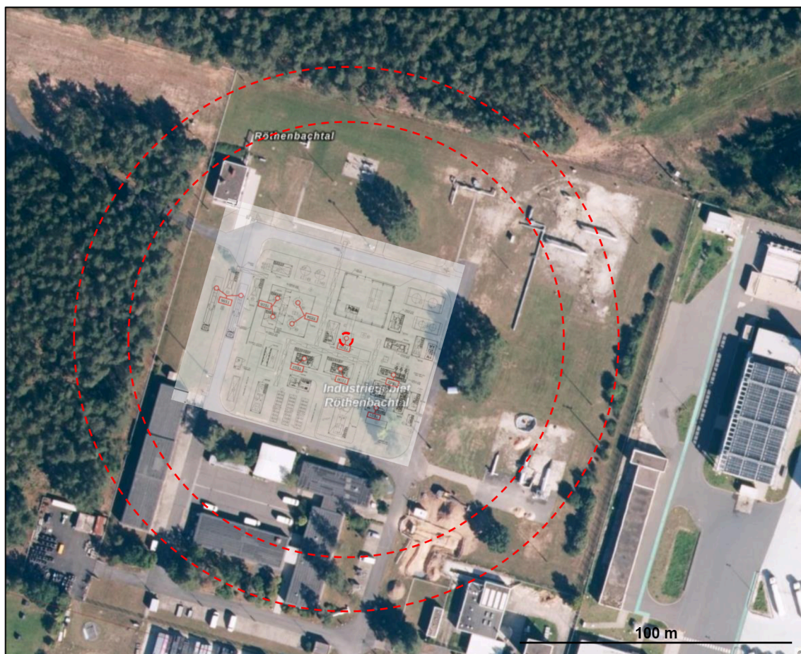
Abbildung 2: Darstellung der Entfernung von 80 und 100 m vom Freisetzungsort (HX7000 / Cold-Box)

Die Reichweiten von 80 und 100 Metern ausgehend vom Freisetzungspunkt (Wärmeübertrager HX7000 / Cold Box) sind in der nachfolgenden Abbildung 2 dargestellt. Auf dem benachbarten Betriebsbereich der Firma Linde wird der Beurteilungswert des Leitfadens KAS-55 für das betrachtete Dennoch-Szenario nicht erreicht. Dennoch ist bei den Gebäuden der Firma Linde, die sich direkt an der Grenze der Betriebsbereiche befinden, mit bis zu 50 % Glasscheibenbruch zu rechnen.