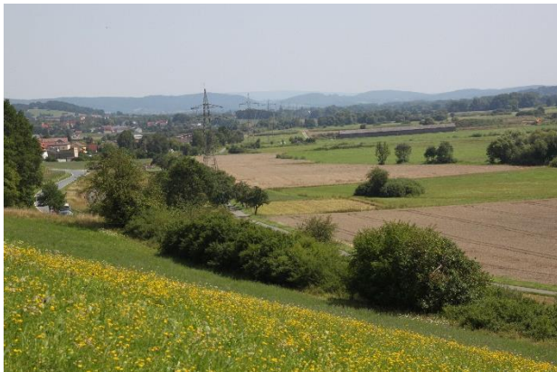
Abb. 3: Blick von nördlich Mainroth auf das UG