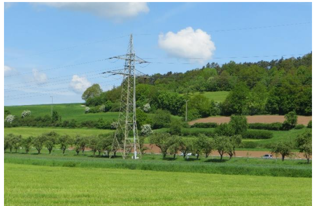
Abb. 4: Heckenlandschaft und Streuobst bei Mainroth