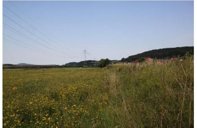
Abb. 2: Bahnböschung Richtung Westen