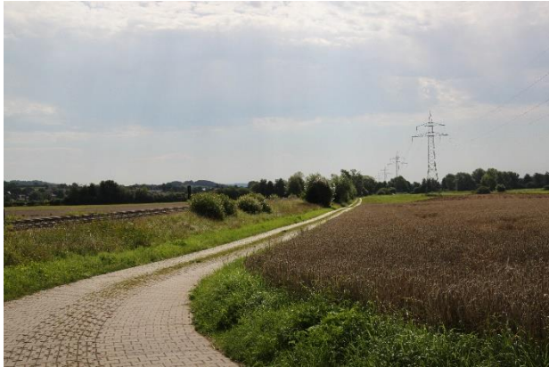
Abb. 1: Radweg Richtung Kulmbach

Innerhalb des UG finden sich landwirtschaftliche Flächen im Hangbereich und in der Mainaue, die als Acker und Grünland genutzt werden. Im Hangbereich sowie entlang der Bahnlinie existieren naturnah ausgebildete Gehölze und Heckenstrukturen. In der Mainaue finden sich aktuelle und ehemalige Kiesabbaubereiche, die teilweise wieder verfüllt bzw. als Stillgewässer vorhanden sind. Der zu betrachtende Wirkraum enthält Lebensraumstrukturen für Feldvögel, Vögel der Hecken und Gehölze, der Gewässer und Feuchtgebiete. Die Landschaft bietet darüber hinaus Jagd- bzw. Nahrungshabitate für Fledermäuse. Reptilien (Zauneidechse) nutzen die Bahnlinie sowie Wegränder und Ranken im Nordosten des Gebiets als Lebensraum, Verbindungs- und Ausbreitungskorridor.