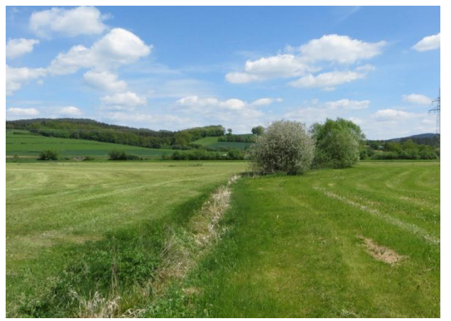
Abb. 6: Mainaue im Osten des UG