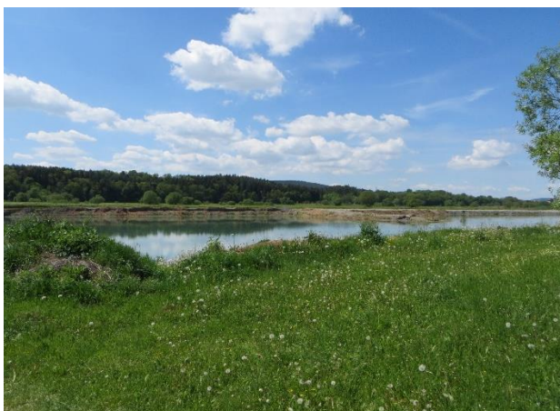
Abb. 5: Abbaugewässer in der Mainaue