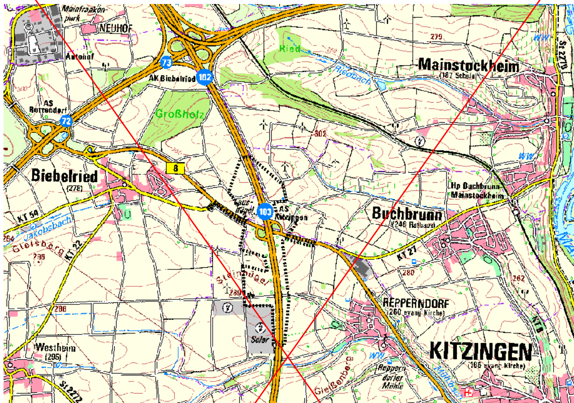
Abbildung 1: Lage des Untersuchungsgebiets

Das Untersuchungsgebiet (vgl. Abbildung 1: Lage des Untersuchungsgebiets) erstreckt sich entlang der BAB A7 von der Brücke südlich (BW 672a), über das Bauwerk Mitte (BW 671c) bis zur Brücke nördlich der AS Kitzingen (BW 671a).