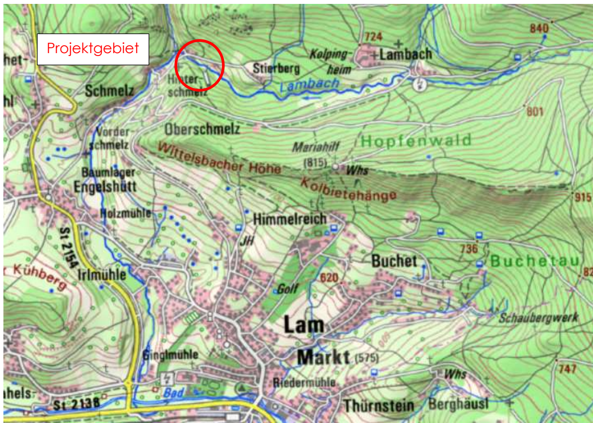
Abbildung 1: Lage WKA Sägmmühle (BayernAtlas 2021)