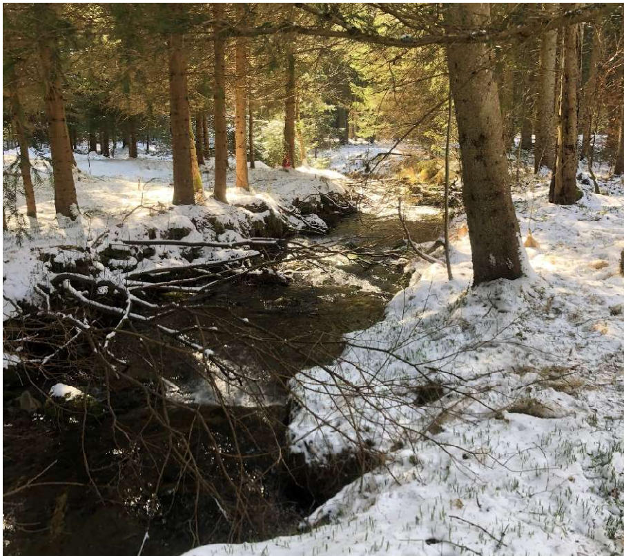
Geplante Ausleitungsstelle