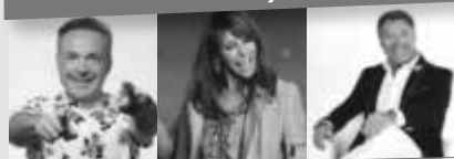
Tim Toupet, Ireen Sheer und Patrick Lindner