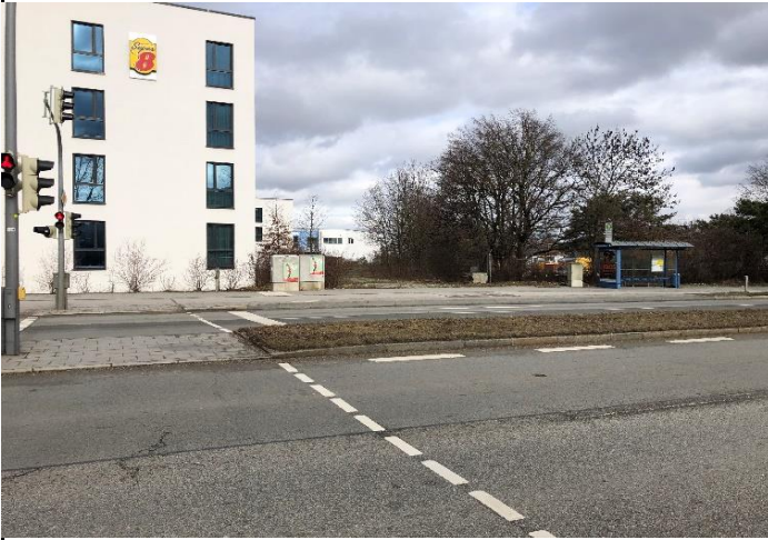
Am Nordring 4