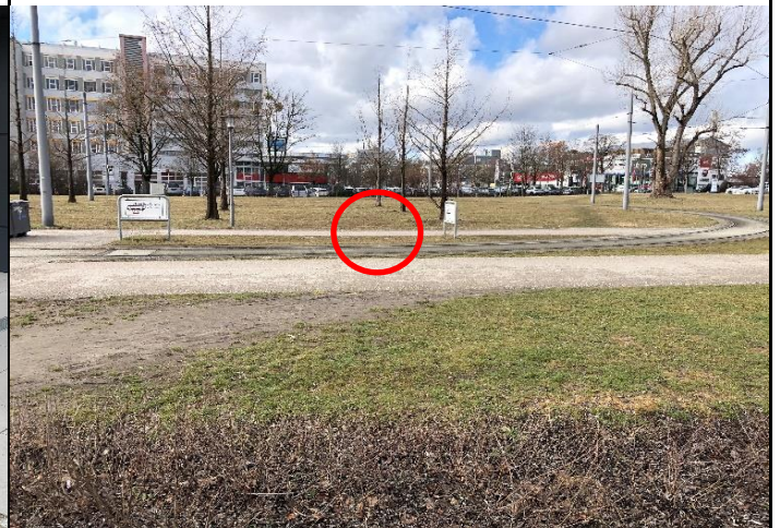
Punkt der Ersatzanregung, Max-Bill-Straße