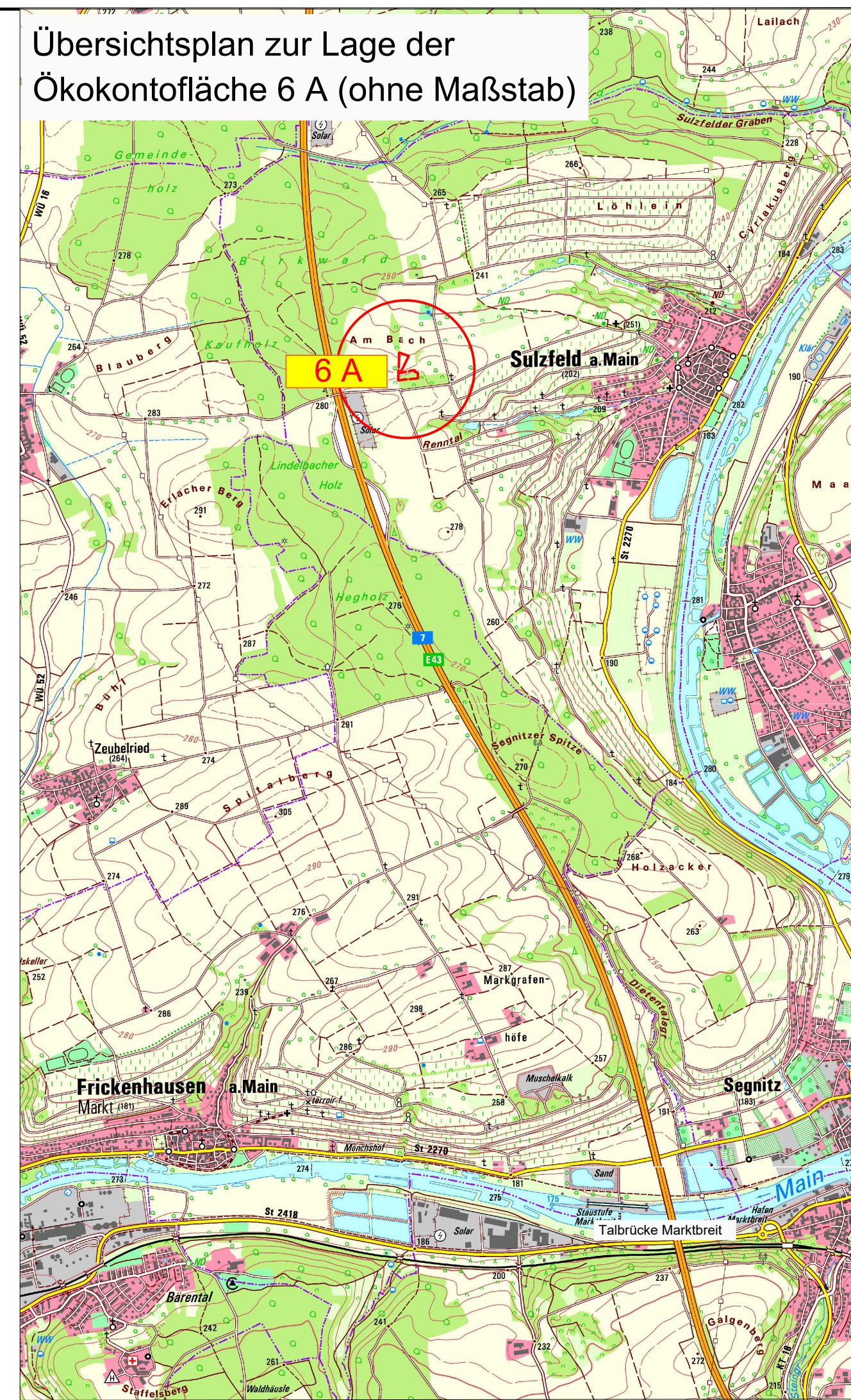
Übersichtsplan zur Lage der Ökokontofläche 6 A (ohne Maßstab)

© Bayerisches Landesamt für Umwelt, www.lfu.bayern.de © Bayerische Vermessungsverwaltung, Geobasisdaten (Darstellung der Flurkarte als Eigentumsnachweis nicht geeignet) Bezugssystem: Gauß-Krüger Transformation UTM<=>GK => 3DIM-SAL Angaben zum Lage- und Höhenreferenzsystem siehe Planstempel Auszug enthält Daten aus dem Rauminformationssystem