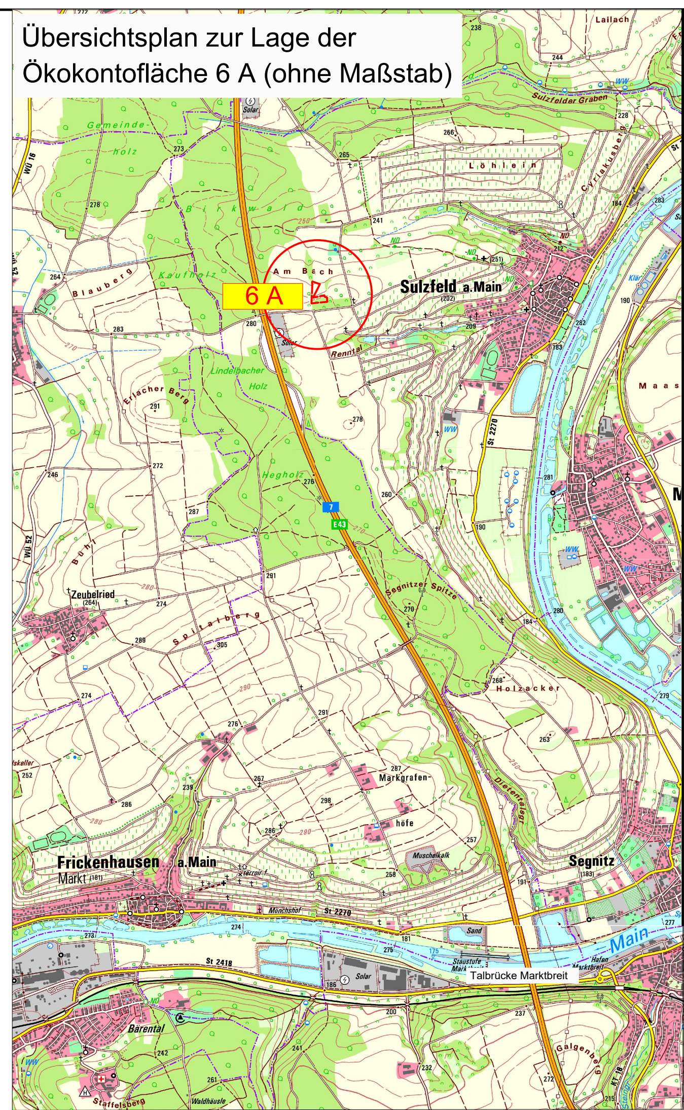
Übersichtsplan zur Lage der Ökokontofläche 6 A (ohne Maßstab)

Tektur vom 21.06.2024 ersetzt Unterlage 9.1/4