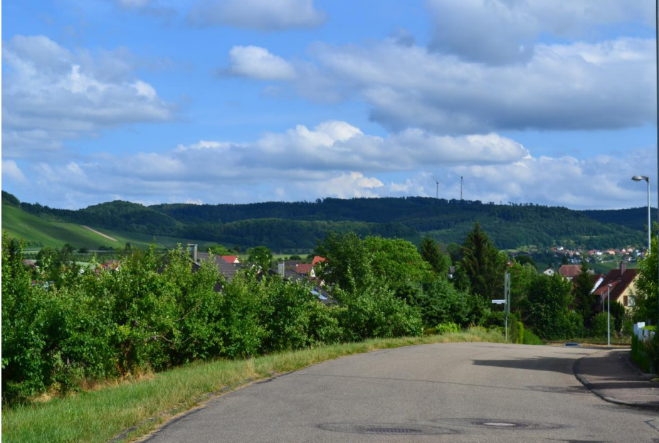
Abbildung 7.5: Blick von Nordwesten auf den geplanten Windpark