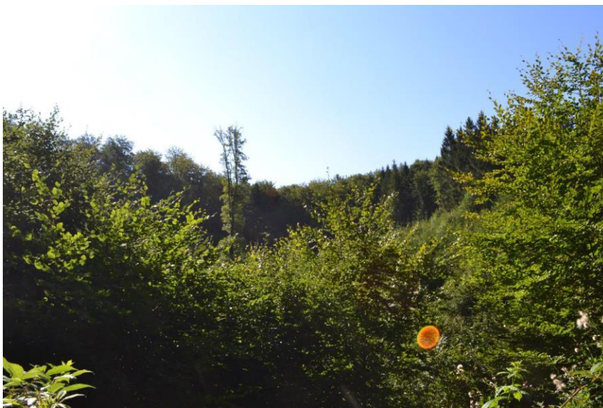
Abbildung 7.2: Blick von Nordosten auf den geplanten Windpark