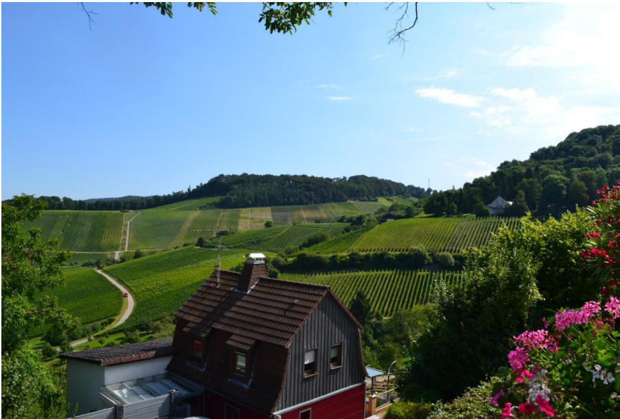
Abbildung 7.3: Blick von Südwesten auf den geplanten Windpark