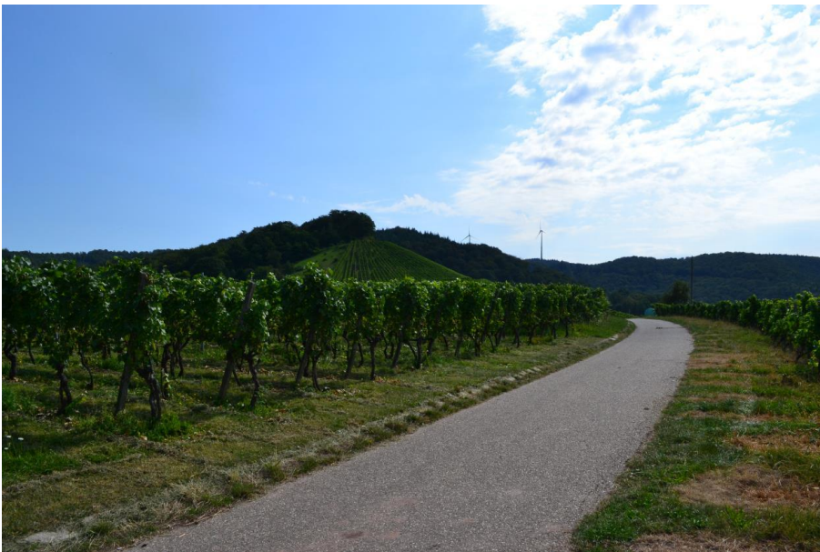
Abbildung 7.4: Blick von Westen auf den geplanten Windpark