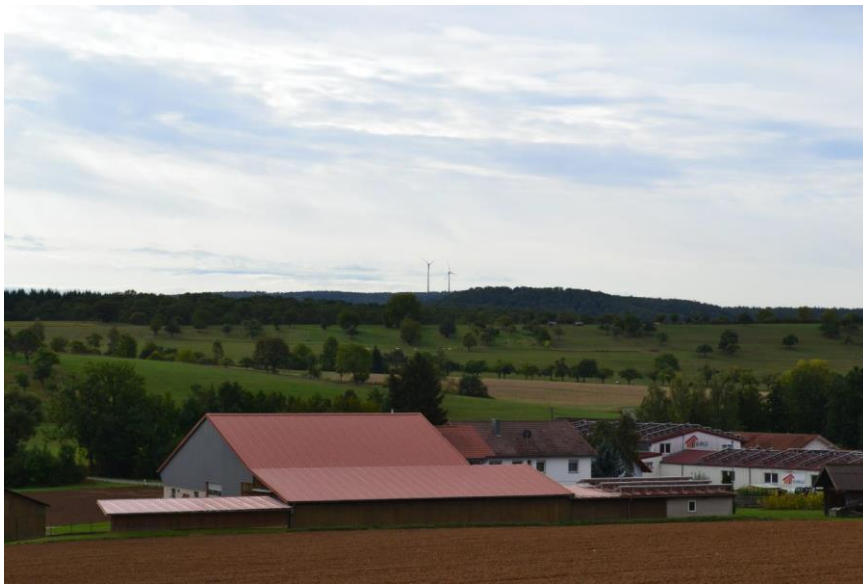
Abbildung 7.1: Blick von Norden auf den geplanten Windpark