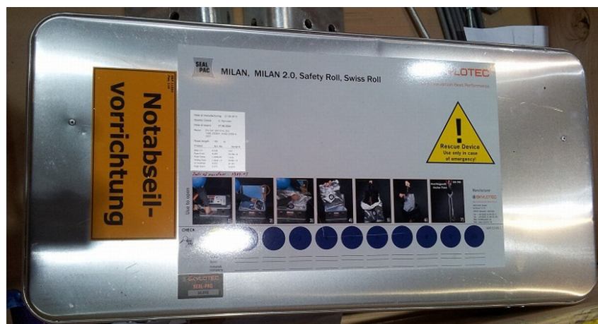
Abb. 3 Notabschlußausrüstung in der WEA