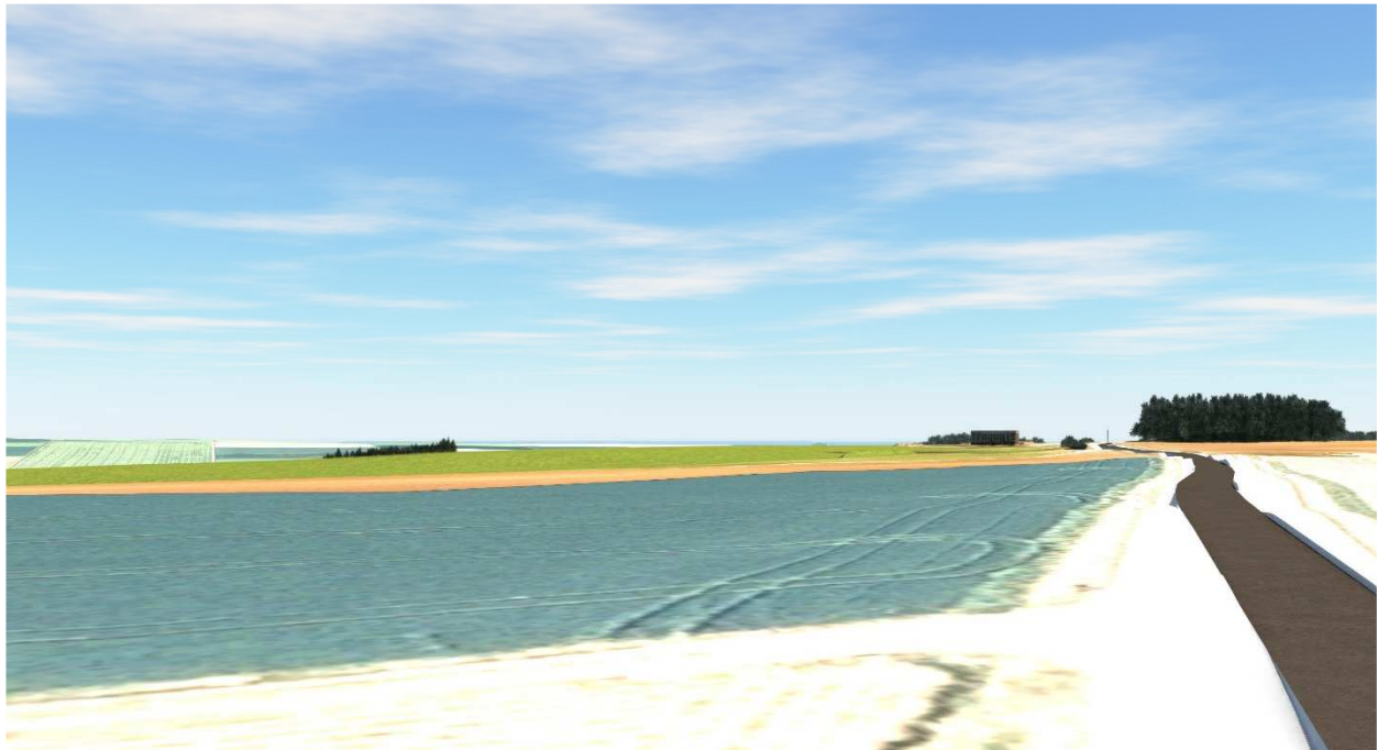
Südwestlich der Deponie