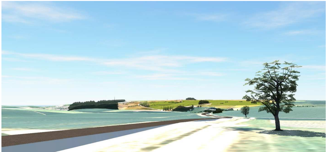
Nördlich der Deponie