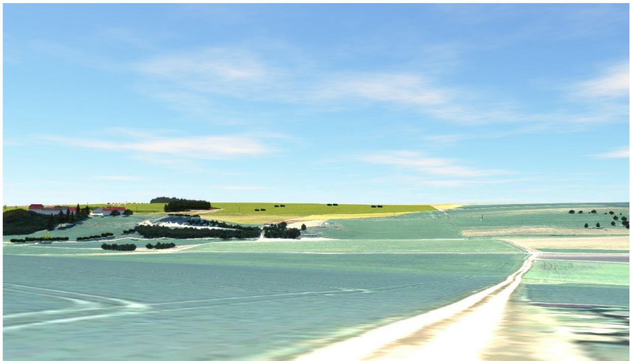
Westlich der Deponie